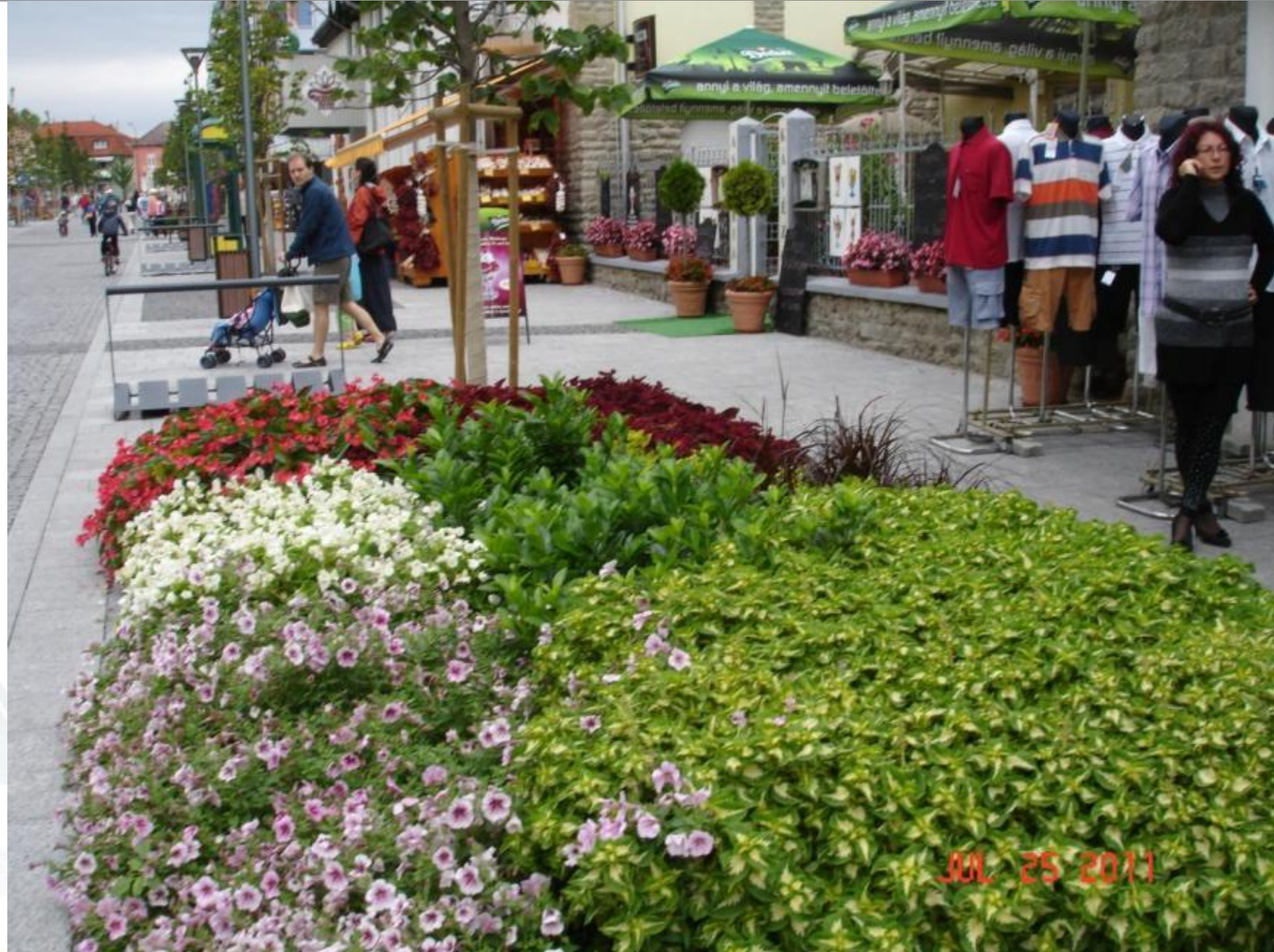
Rákóczi utca, 2011. július