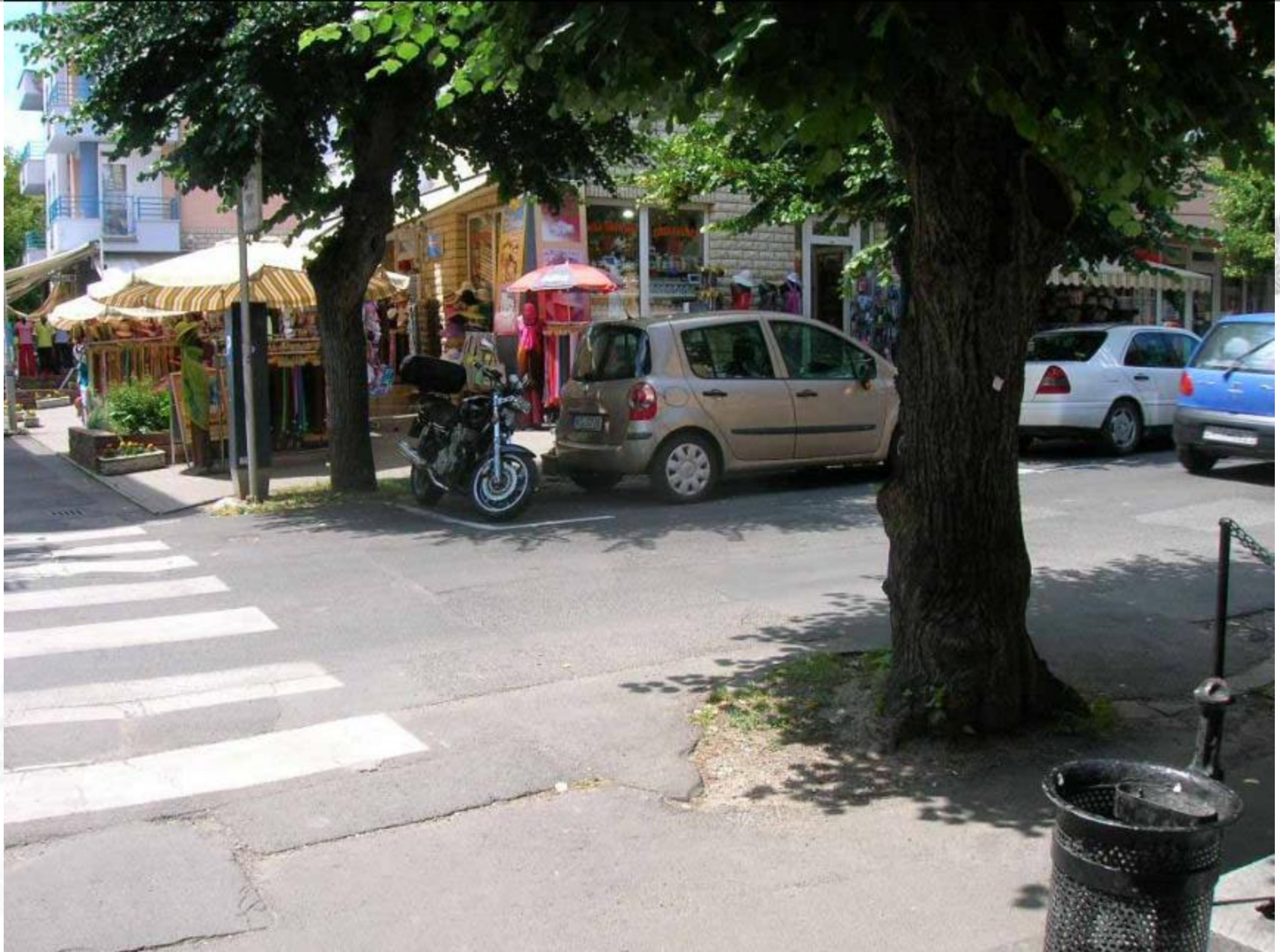
Erzsébet királyné utca korábbi képe