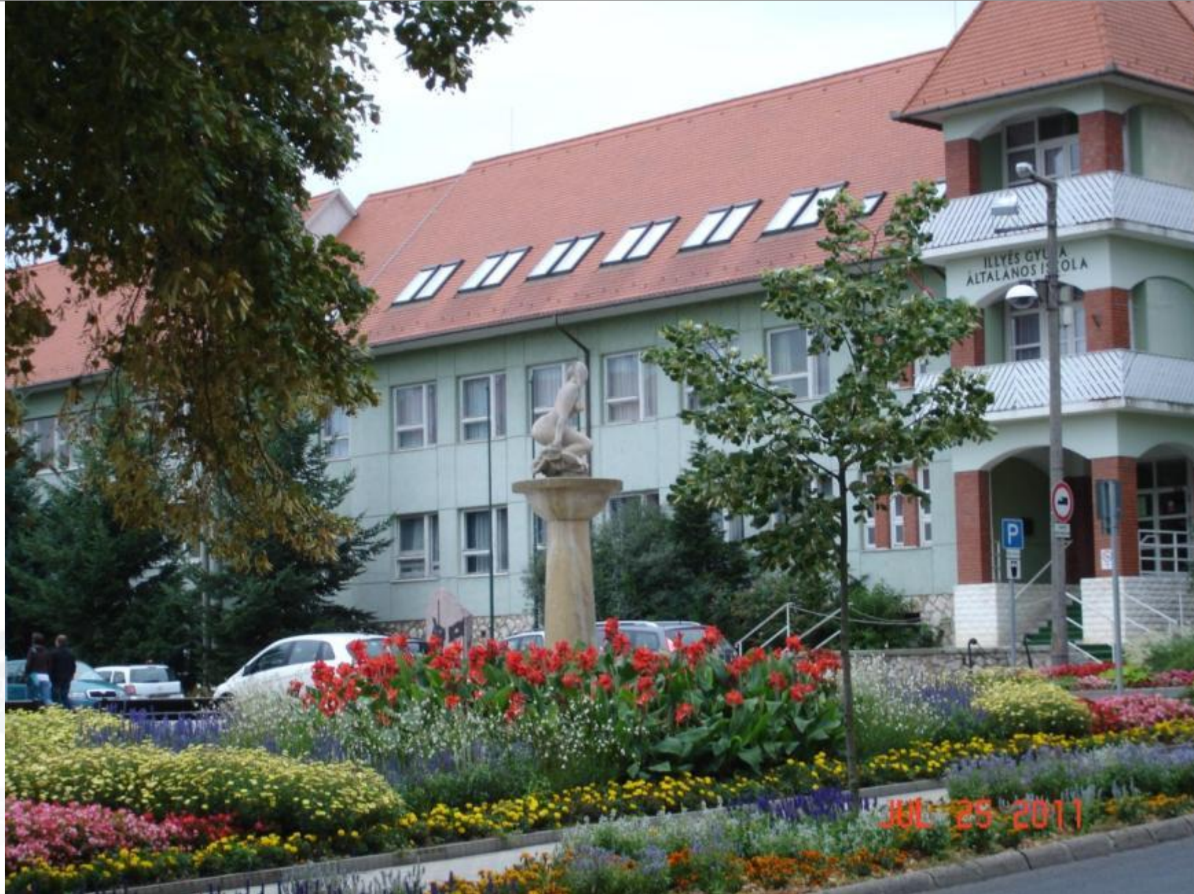
Polgármesteri Hivatal előtt, 2011-ben