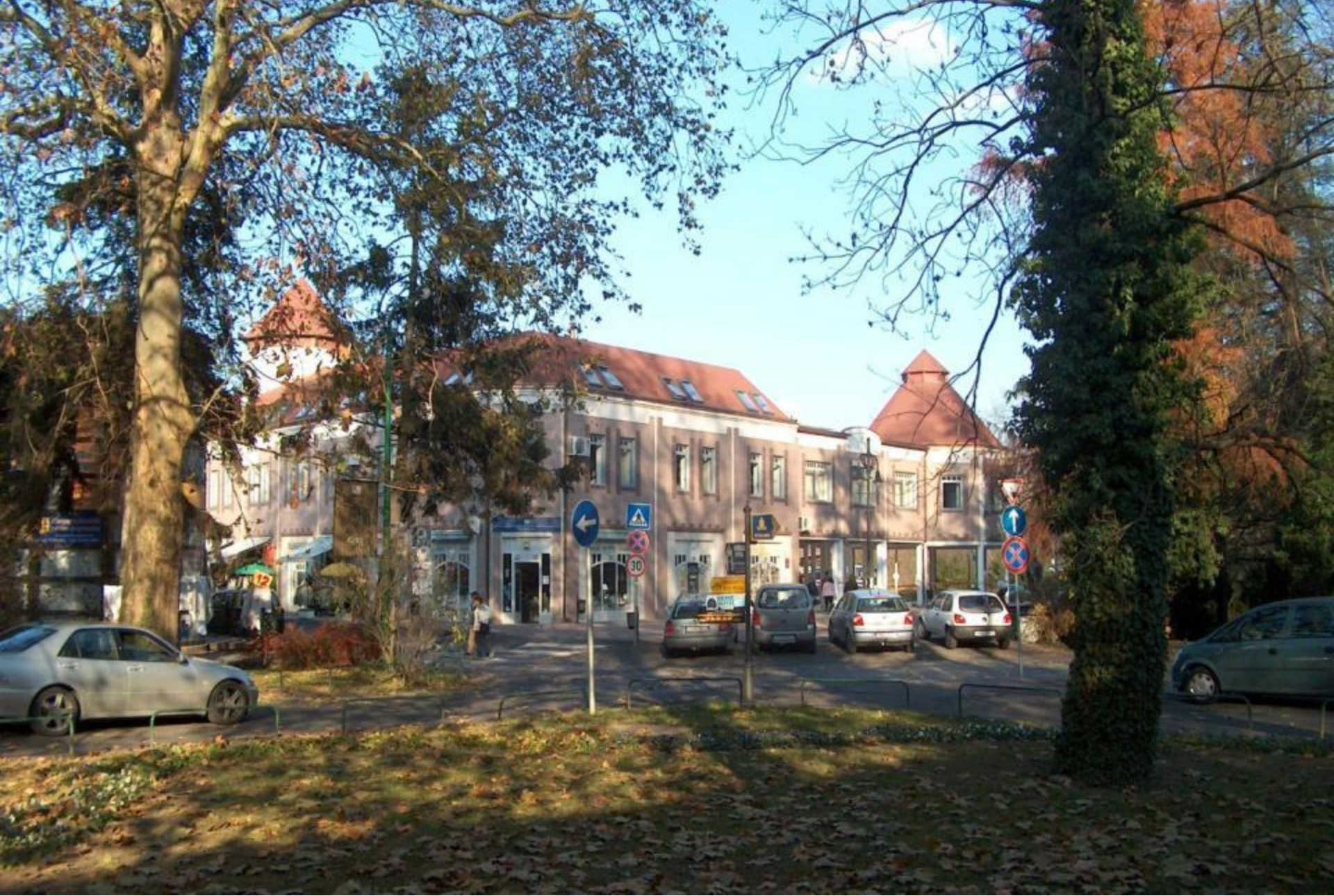
Festetics tér felújítás előtt