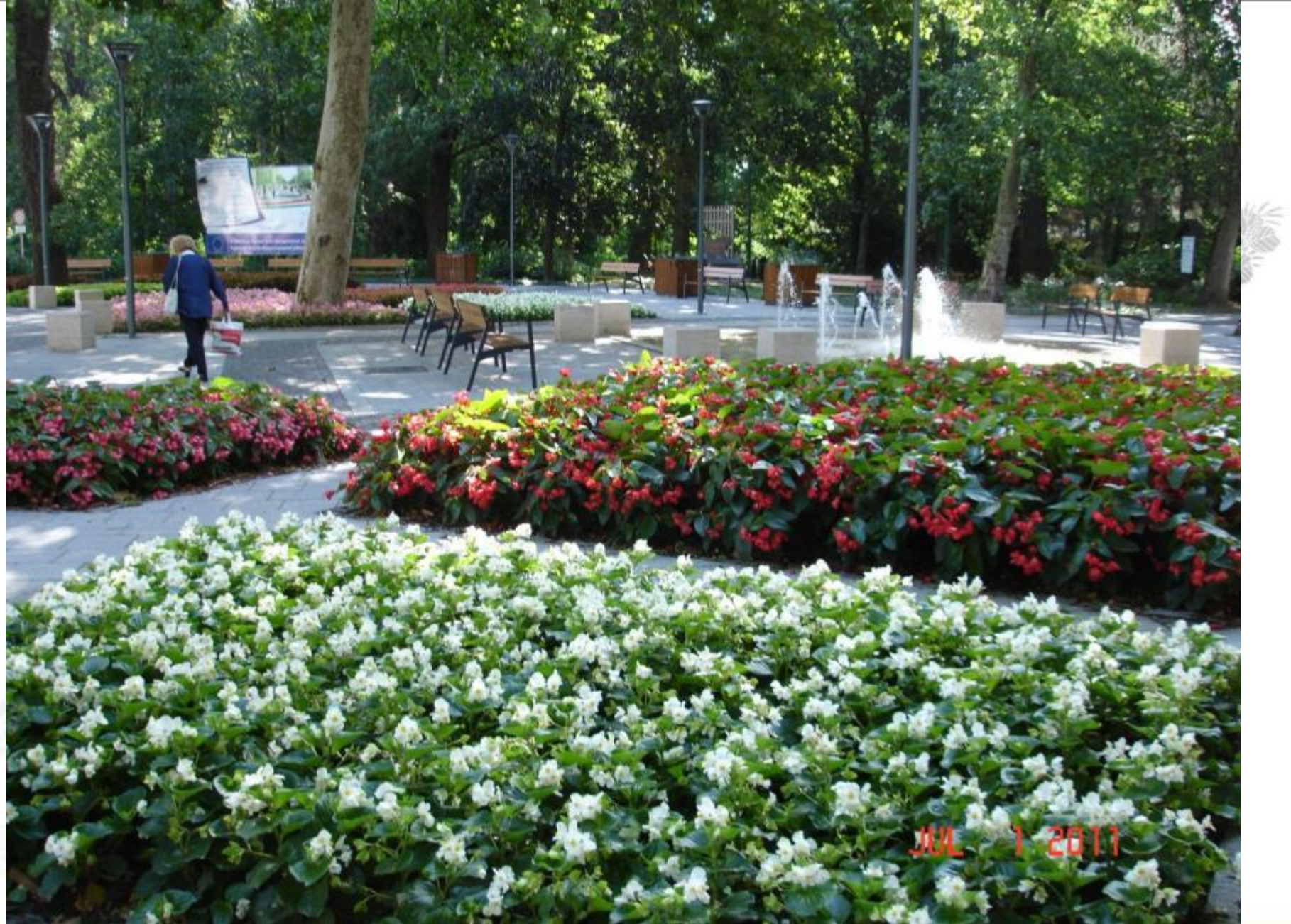
Festetics tér, 2011. július, Begoniák (Lotto, Dragon Wing, Volumnia), háttérben az éger erdővel.