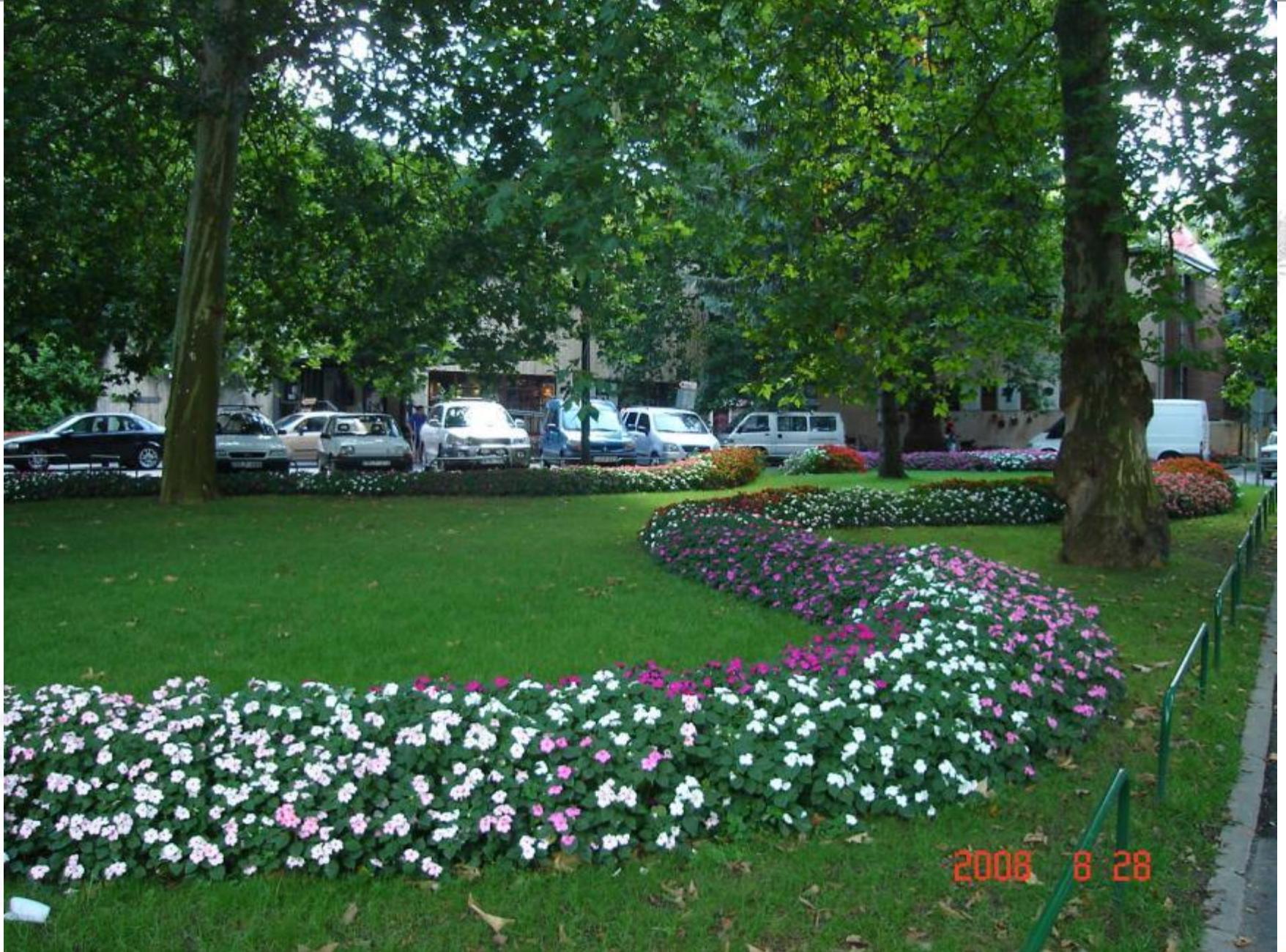
Festetics tér felújítás előtt. Kígyó ágy vízifuksziákkal.