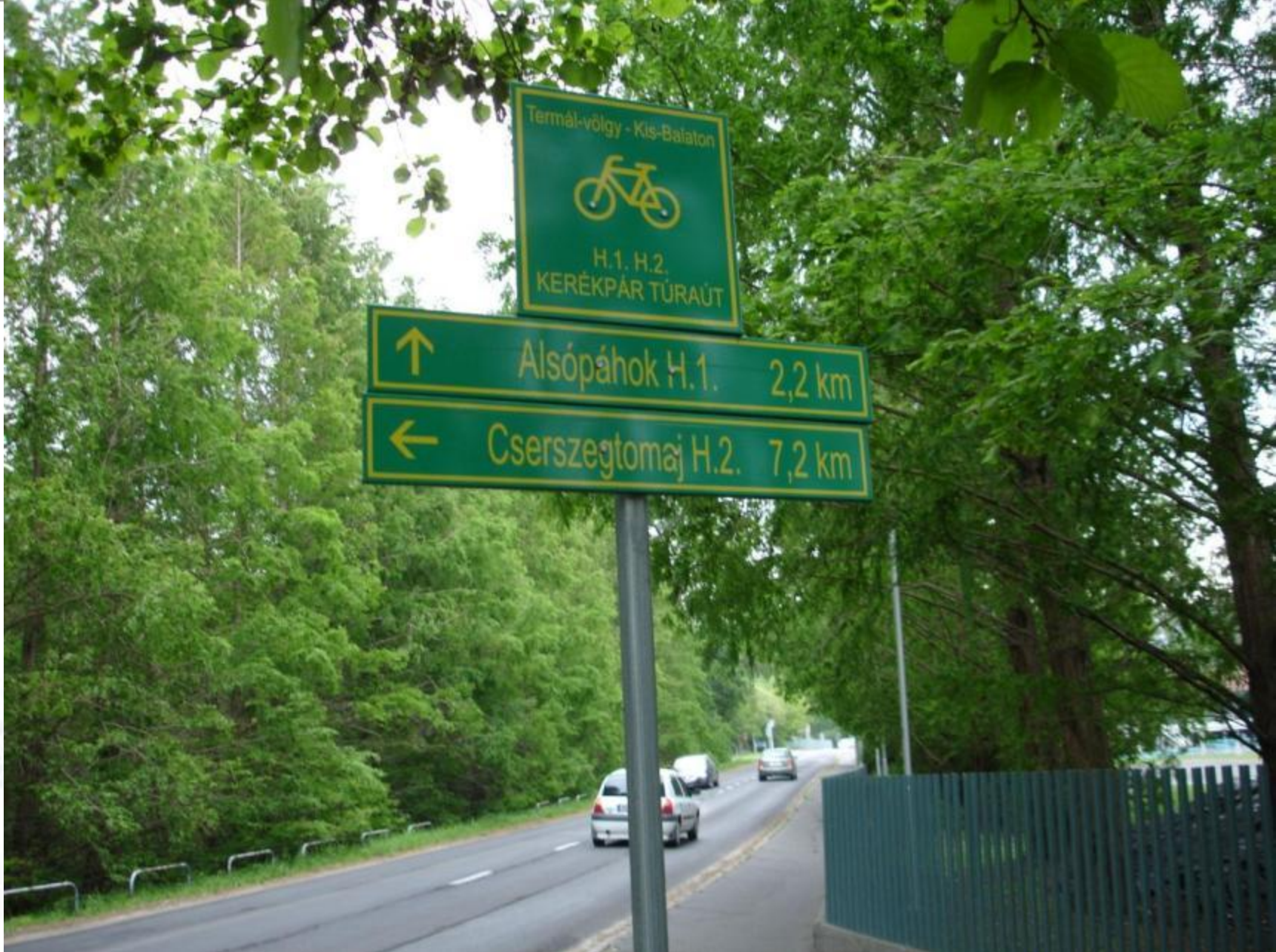
Ady utca, északi véderdő, mocsári ciprusok, kerékpárút