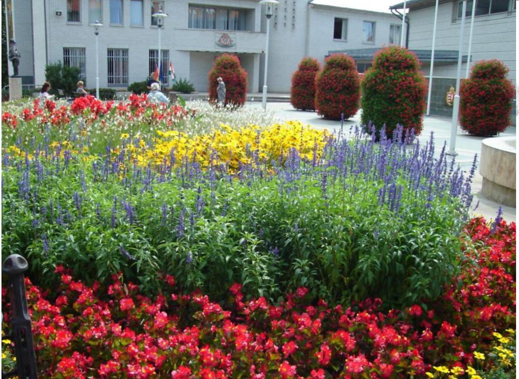
Polgármesteri Hivatal előtt