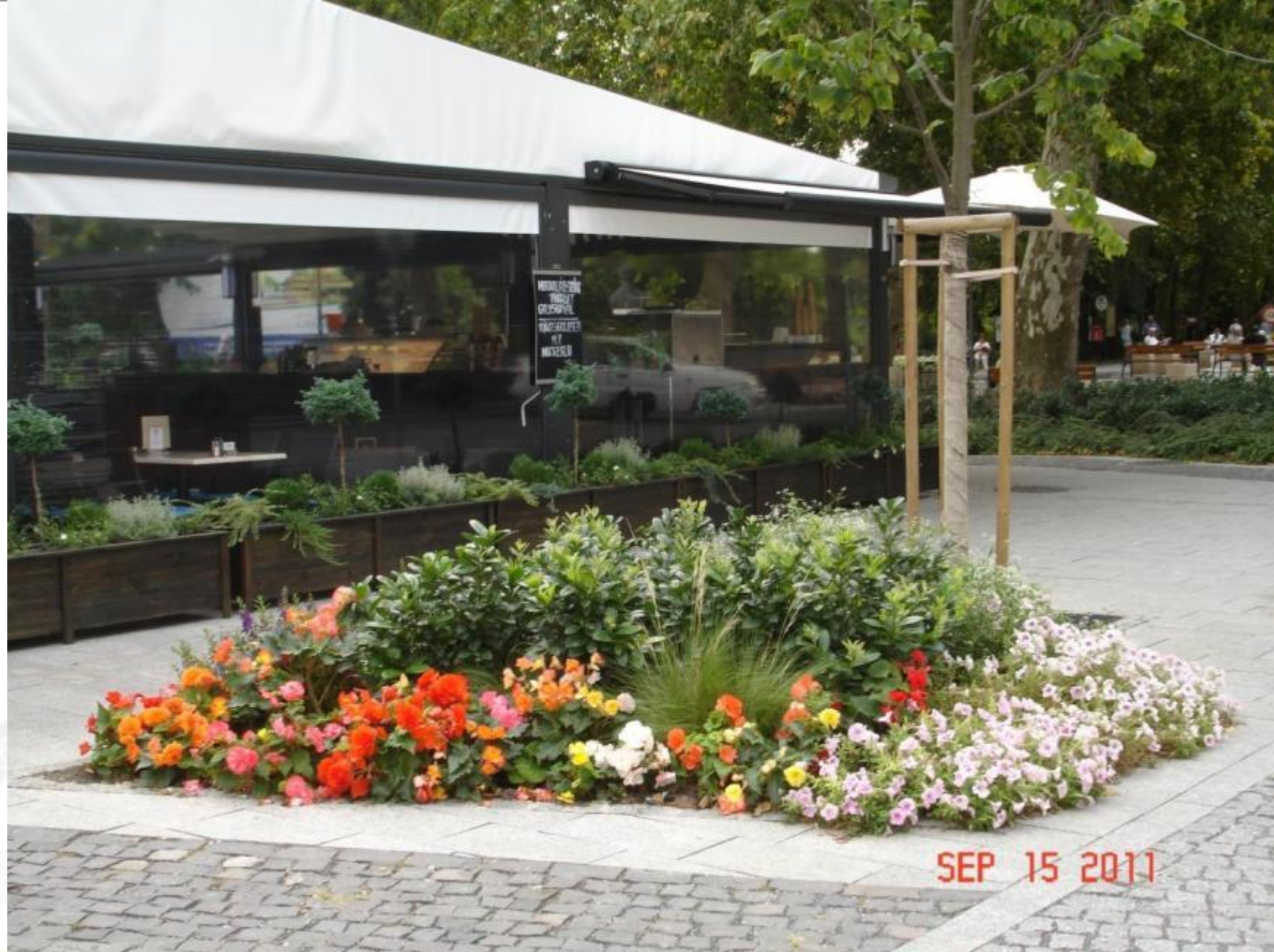
Rákóczi utca, és a Rózsakert étterem, 2011. szeptember