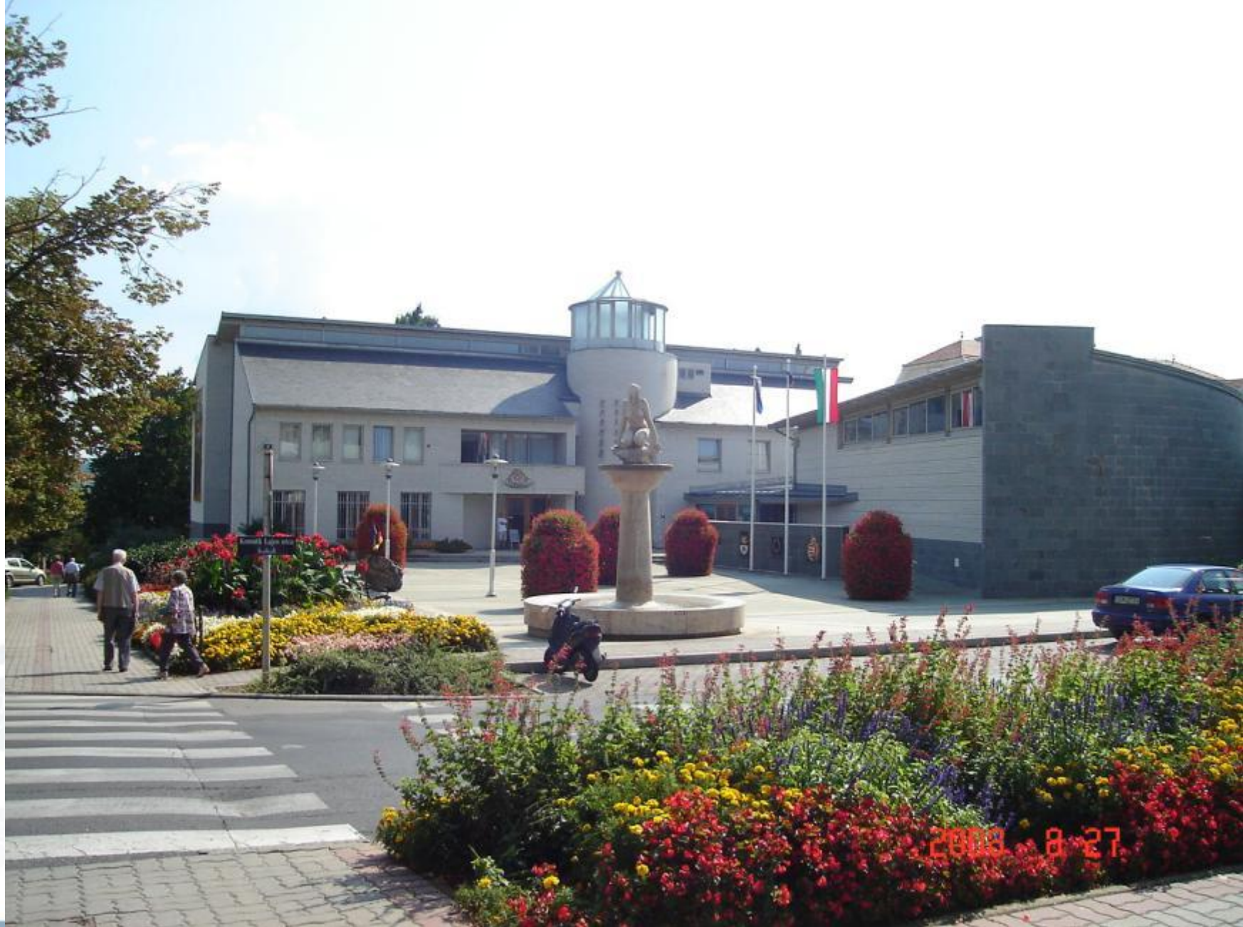
Polgármesteri Hivatal előtt 2008-ban