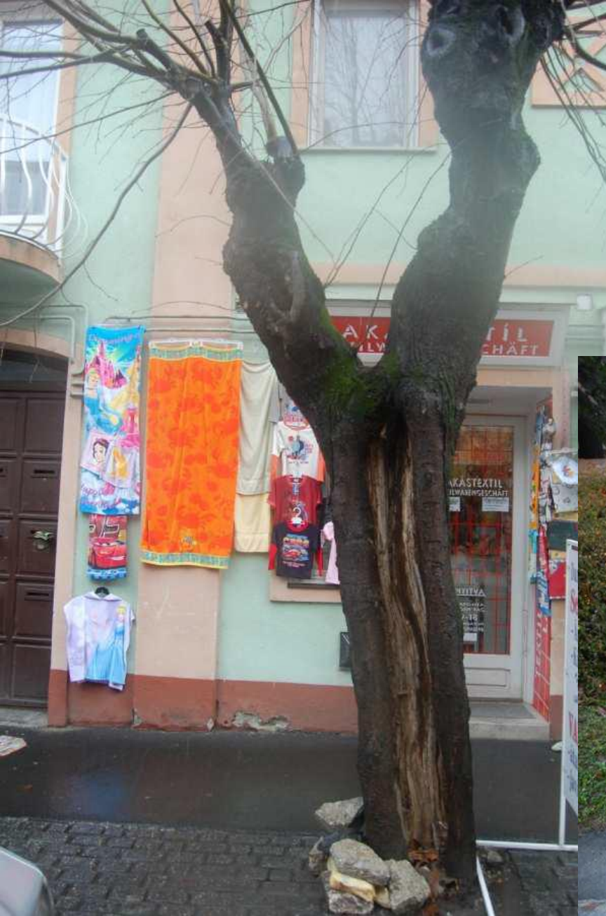
Fagyrepedéses korhadt törzs