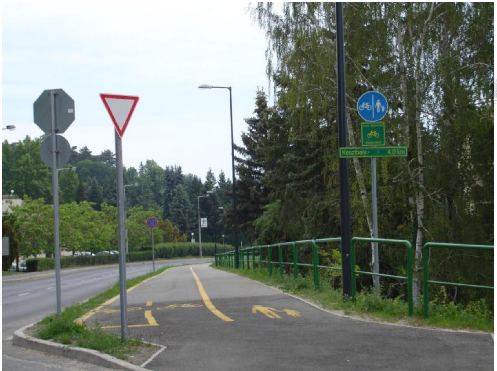
Ady utca, kerékpárút