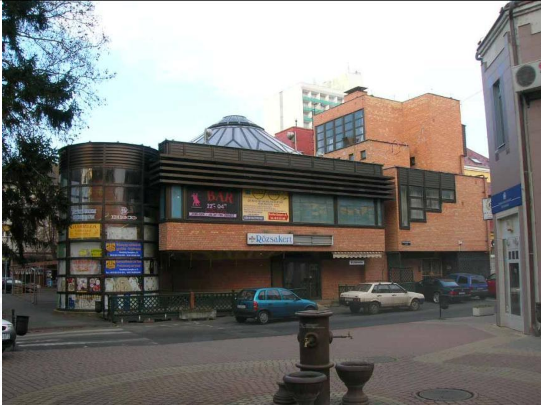
Rózsakert épülete felújítás előtt