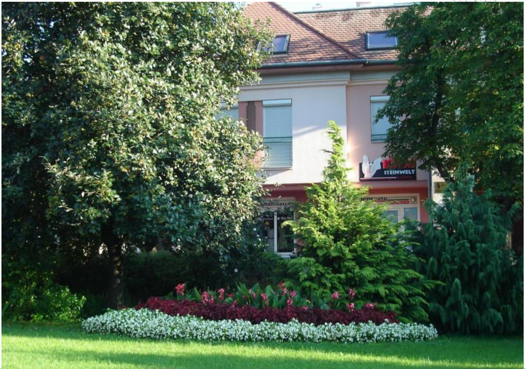
Moll Károly tér