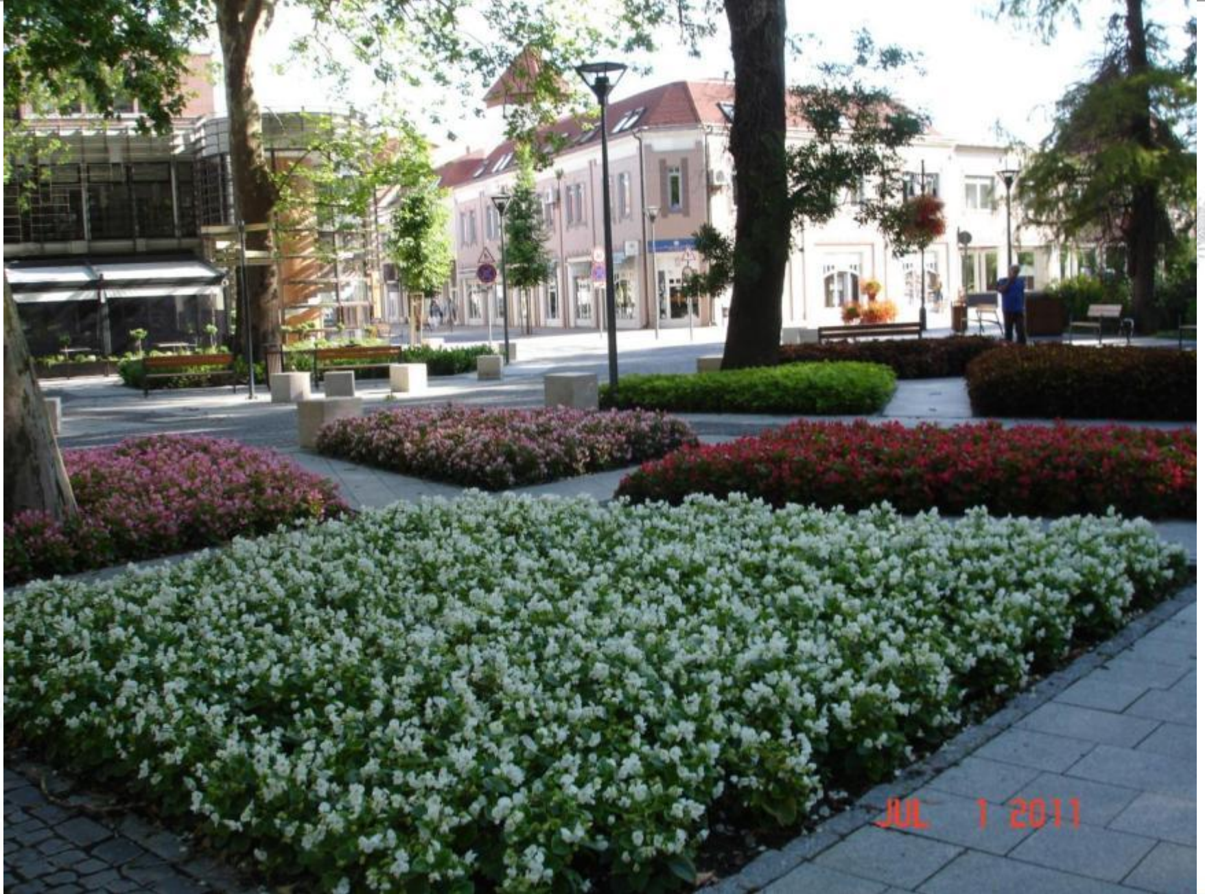
Festetics tér, 2011. július, Volumbia Begoniák, Coleus vegetatív fajták.