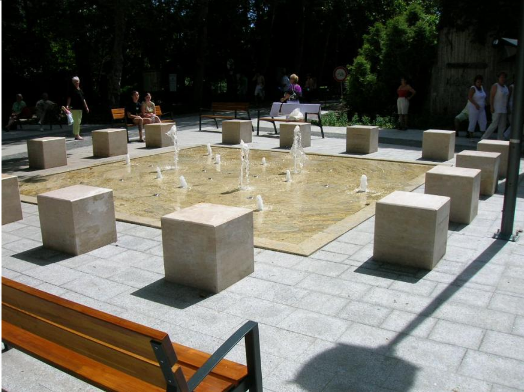
Szökőkút a Fesztetics téren, vízi-játékkal