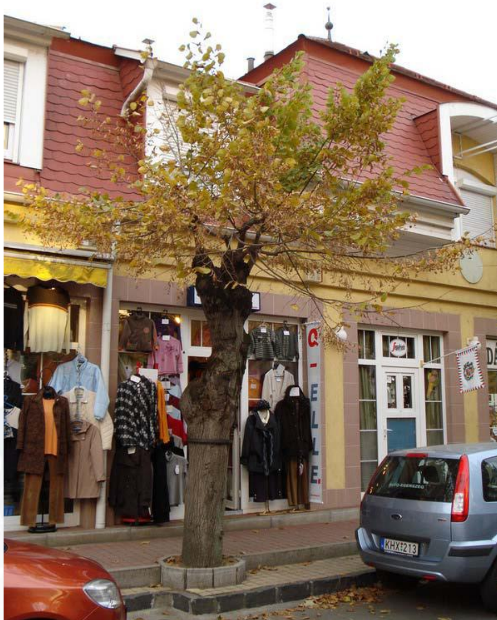
Körbeépített, legyengült, csonkolt hárs, Erzsébet királyné utca.