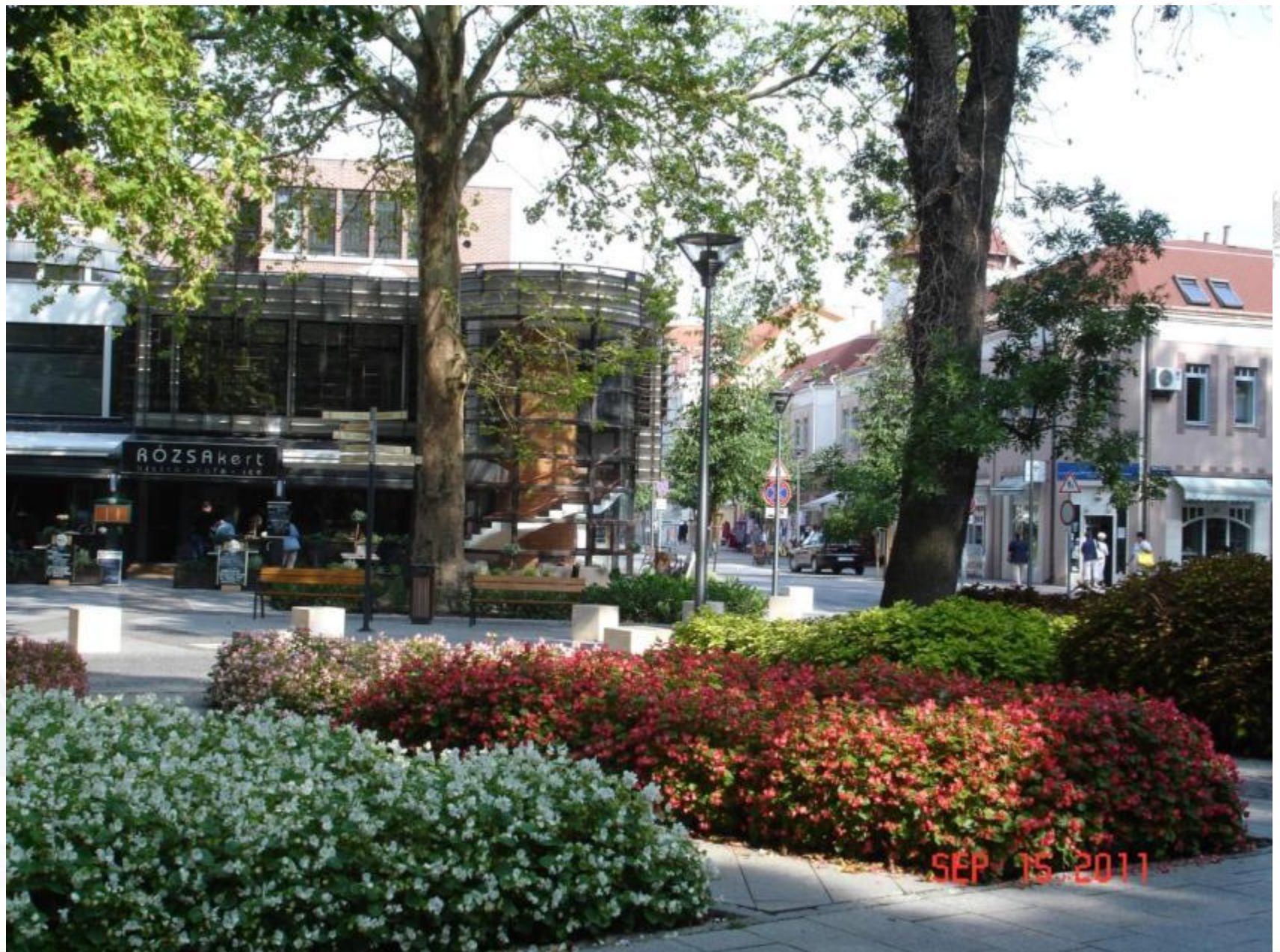
Festetics tér, 2011. szeptember