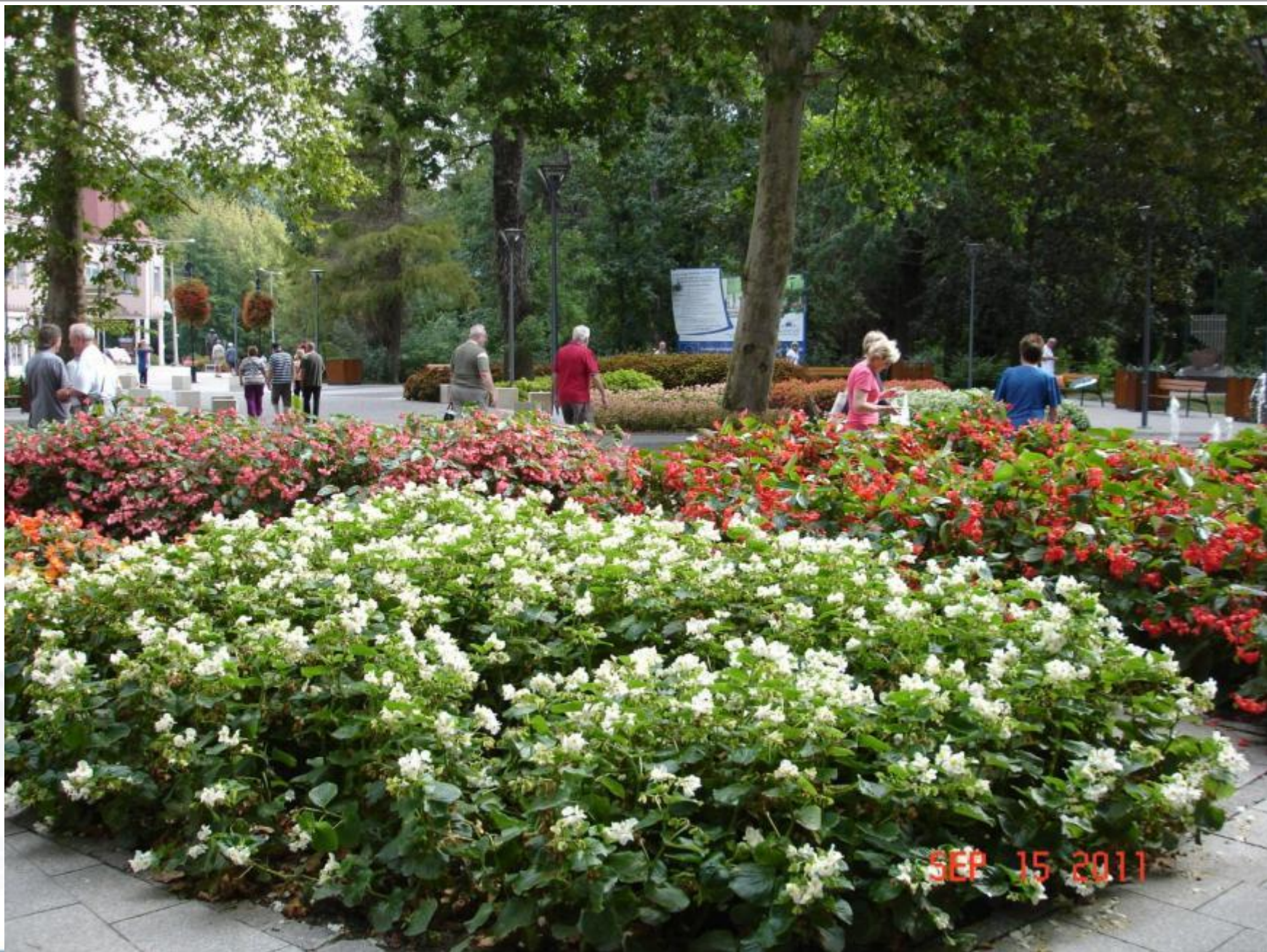
Festetics tér, 2011. szeptember