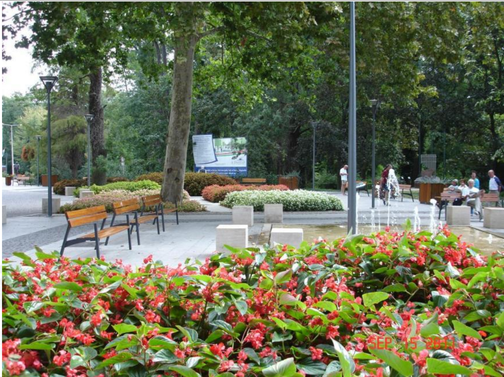
Festetics tér, 2011. szeptember