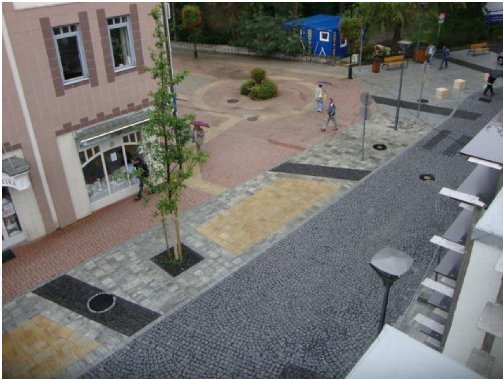
Erzsébet királyné utca, 2010.augusztus