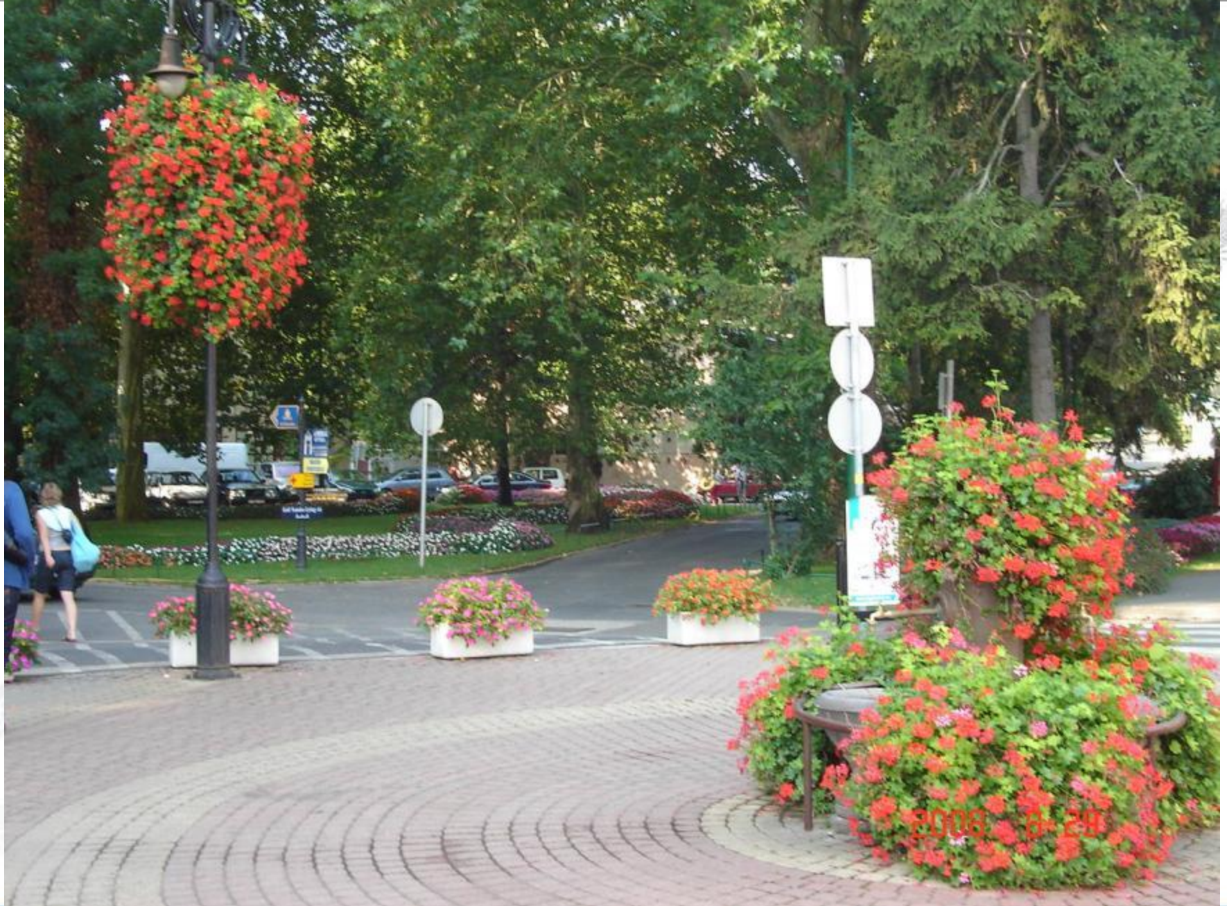
Festetics tér felújítás előtt, kapcsolat a Deák térrel