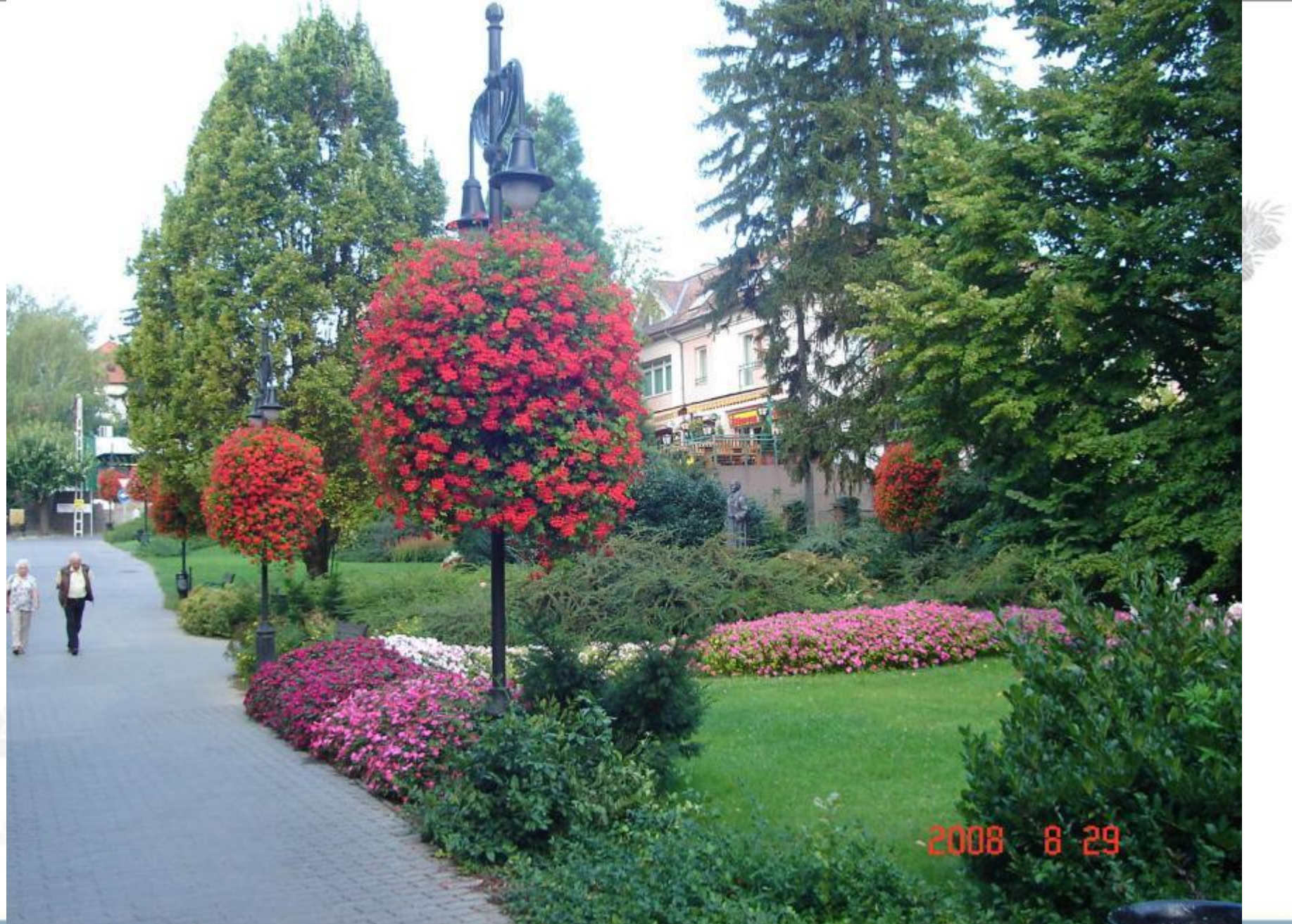
Moll Károly tér