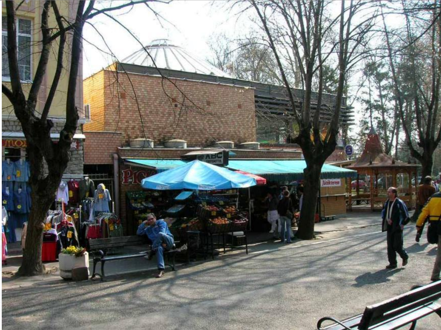
Rákóczi utca felújítás előtt