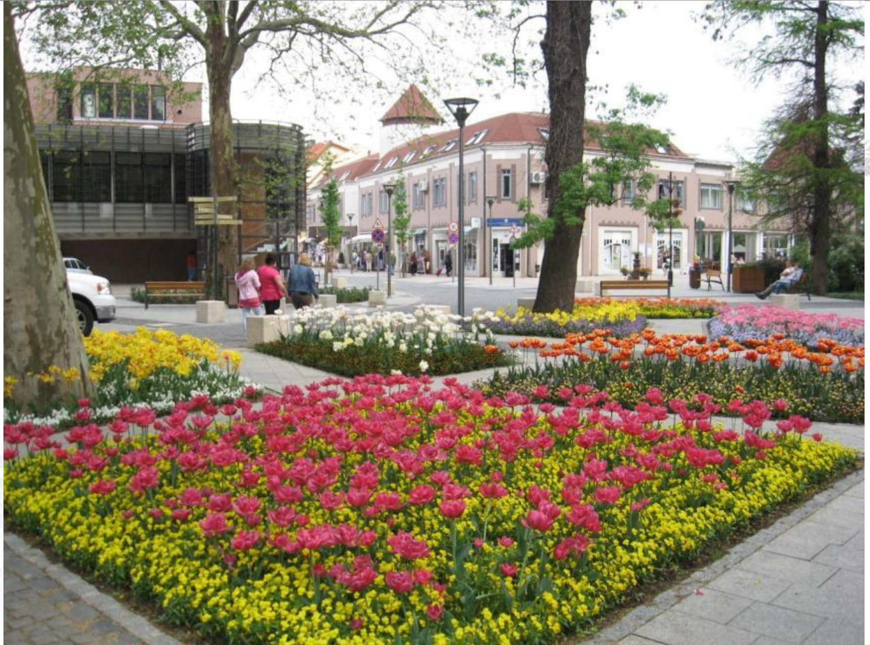
Festetics tér, 2011. április, első beültetés, korai teltvirágú tulipánok, Endurio árvácskák