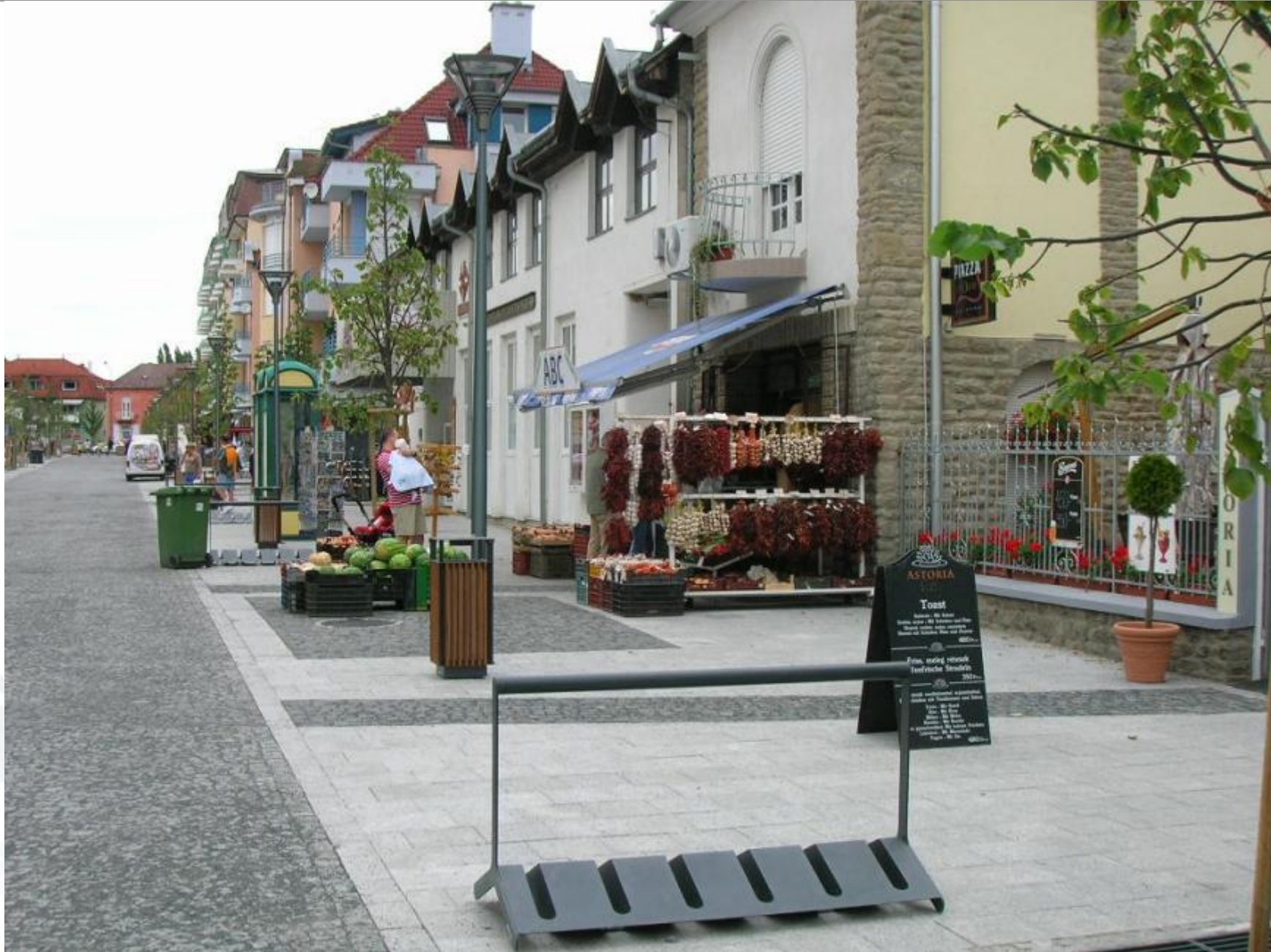
Rákóczi utca, 2010.augusztus.