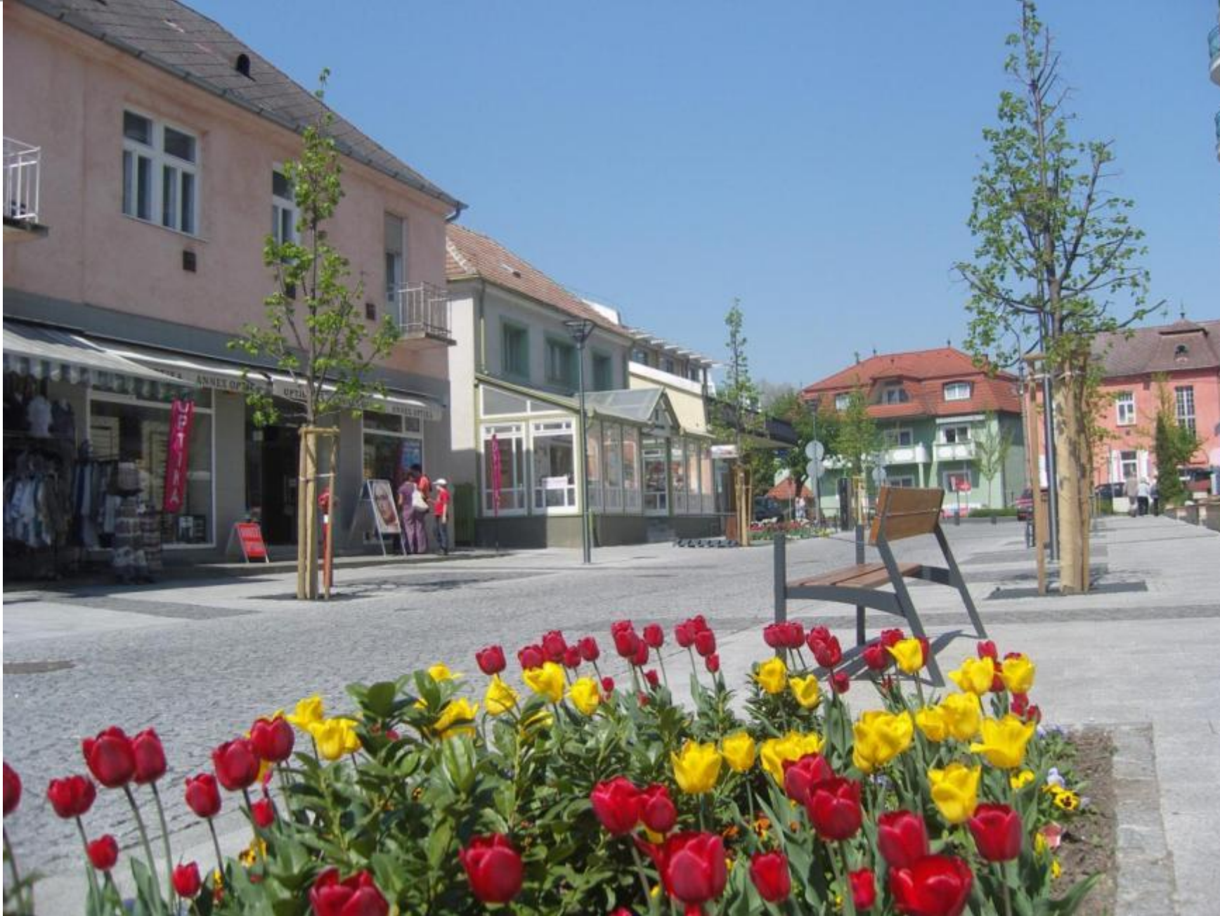
Rákóczi utca, 2011.április