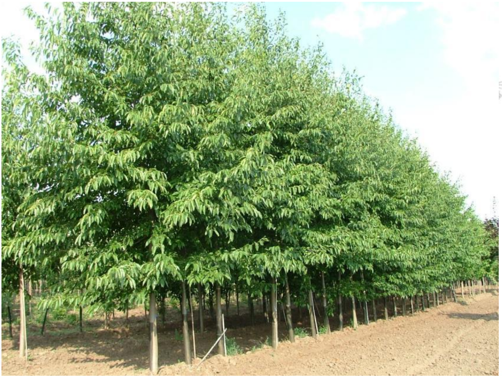
Alnus spatii állomány Alsótekeresen, faiskolában