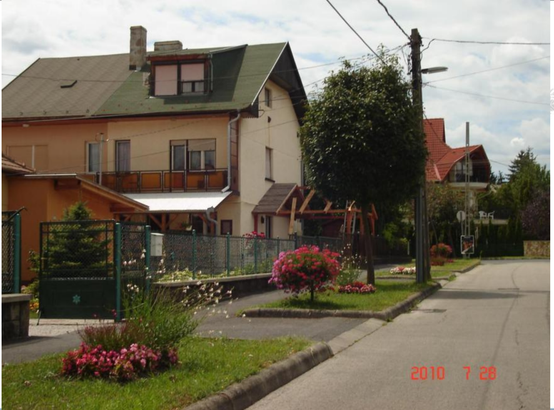
Honvéd utca, lakossági kiültetés