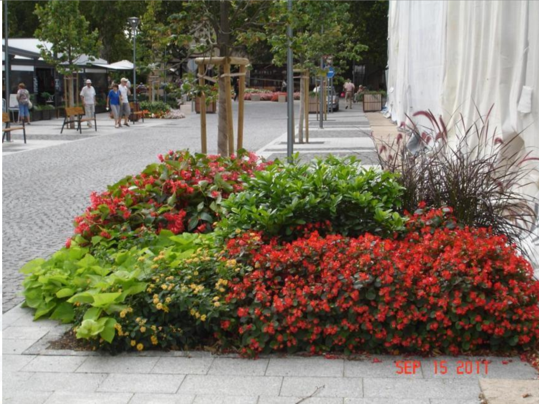
Rákóczi utca, 2011. szeptember