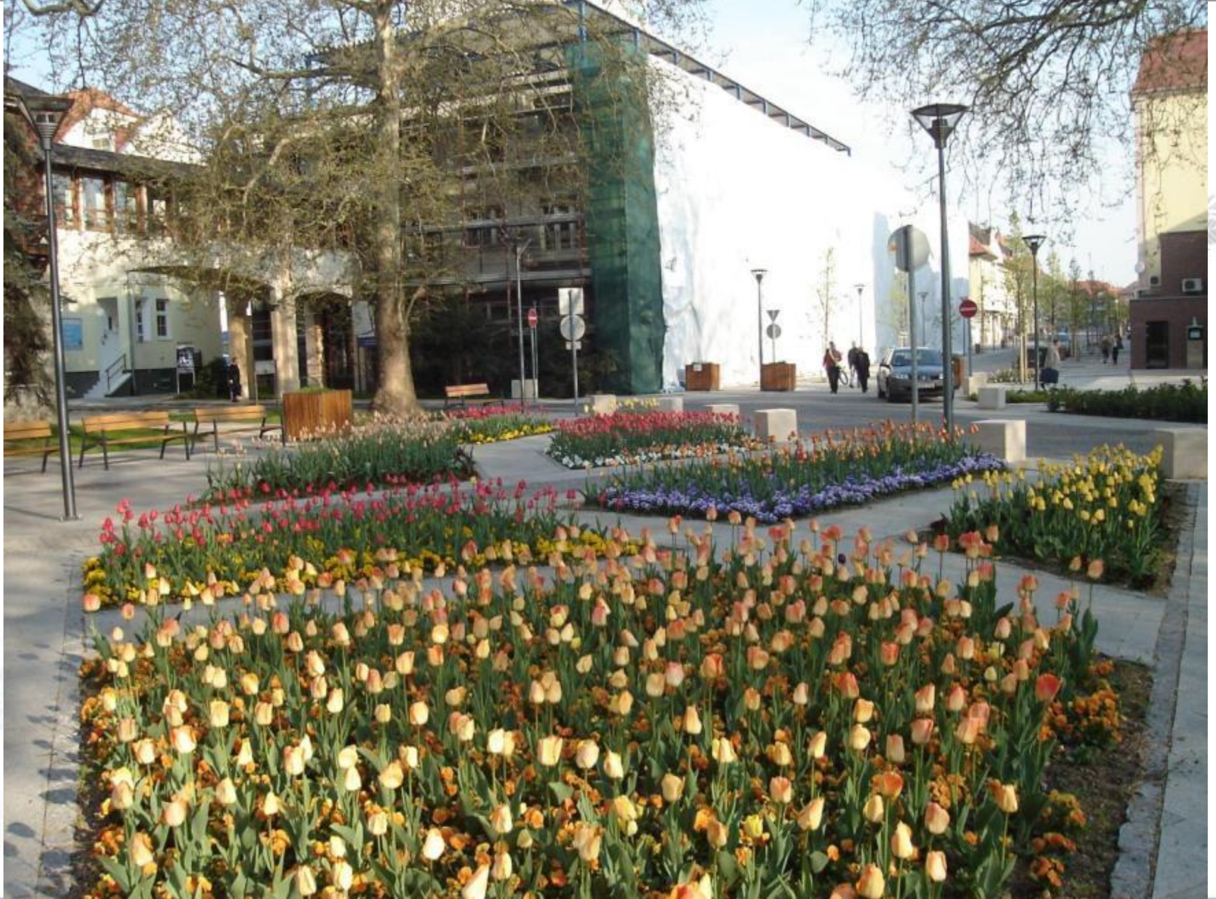
Festetics tér, 2011 április, Triumph tulipánok a virágzás kezdetén, illatos Patiola árvácskák.