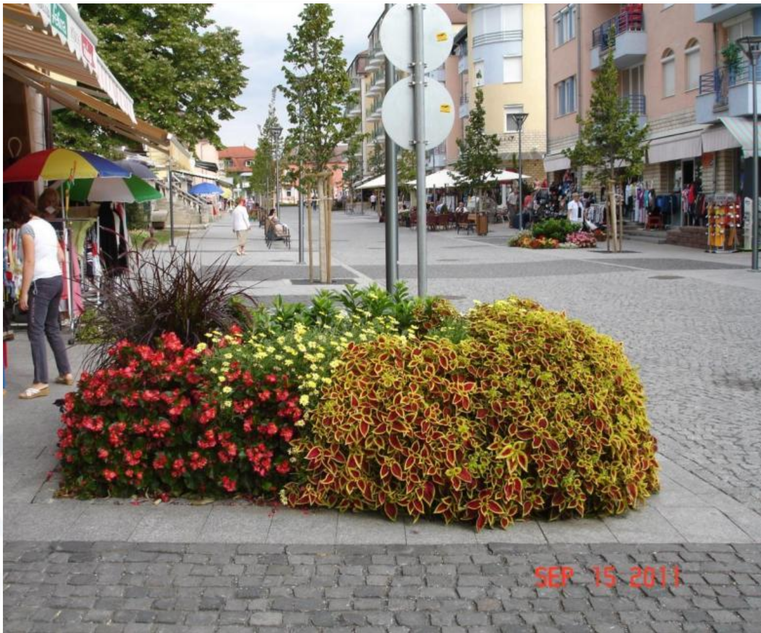
Rákóczi utca, 2011. szeptember