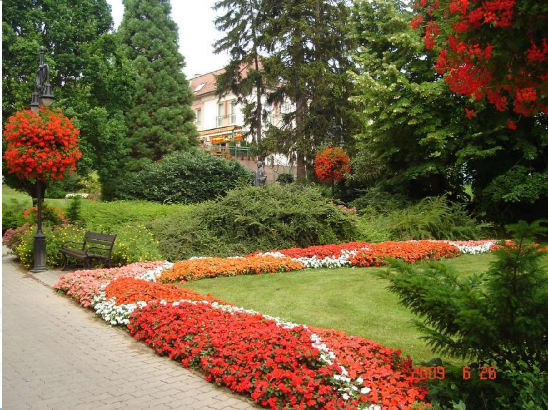
Piros – fehér - zöld, Moll tér