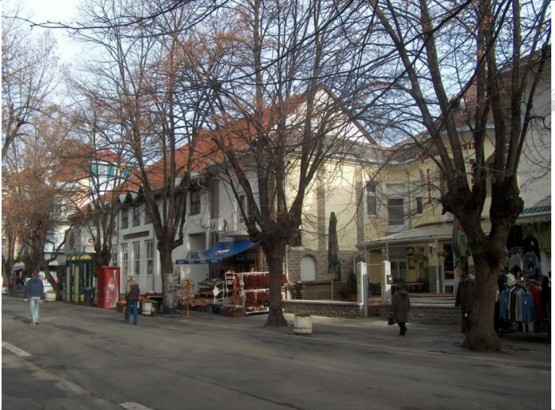
Rákóczi utca felújítás előtt.