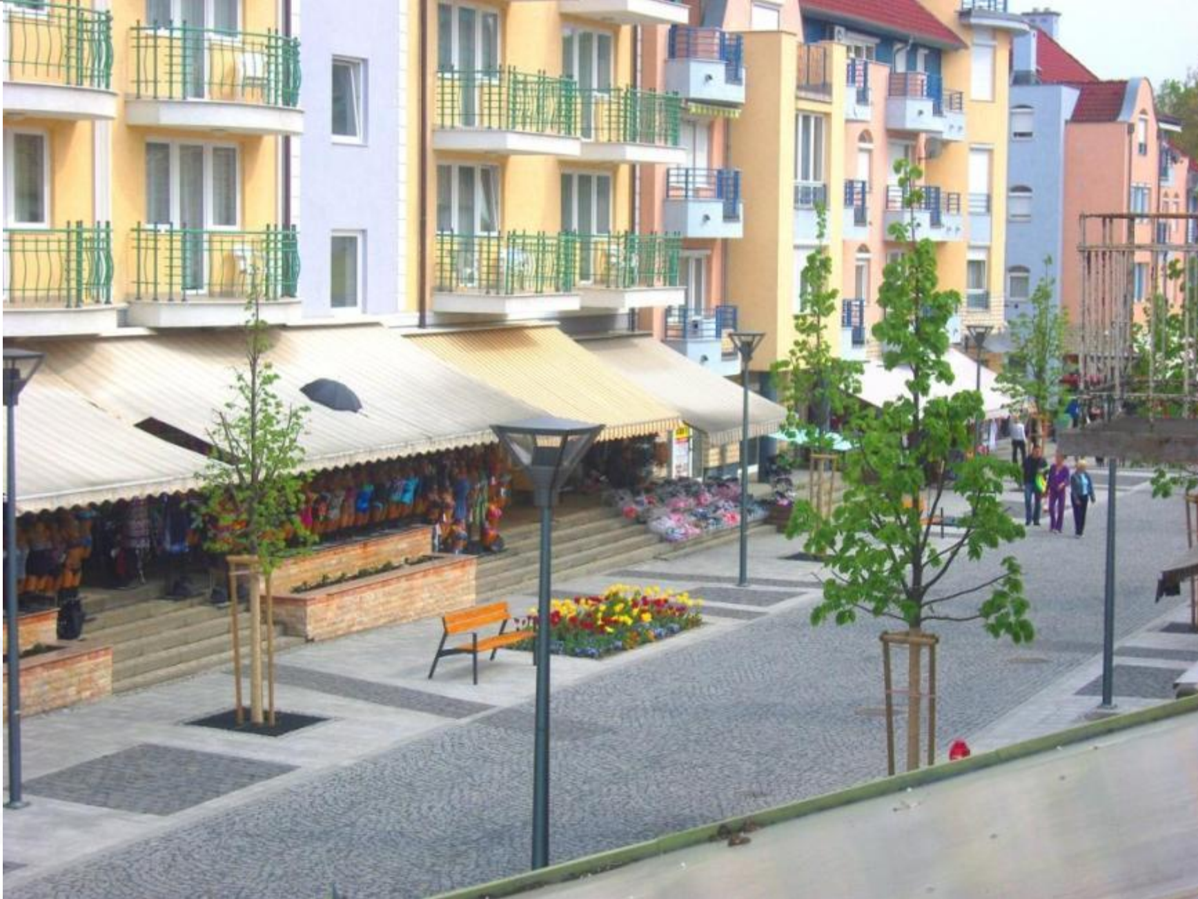
Rákóczi utca, 2011.április