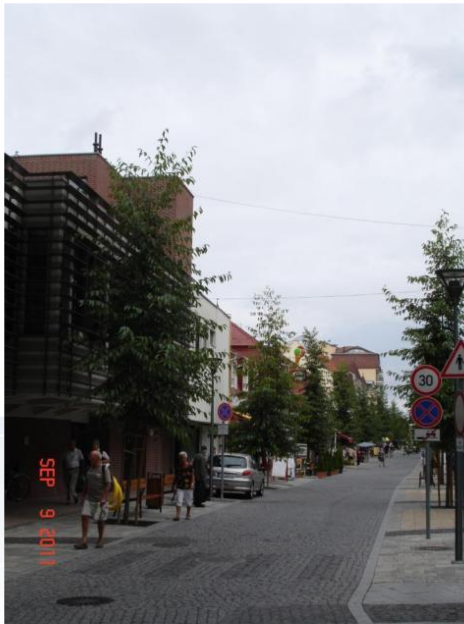
Erzsébet királyné utca, 2011.szeptember