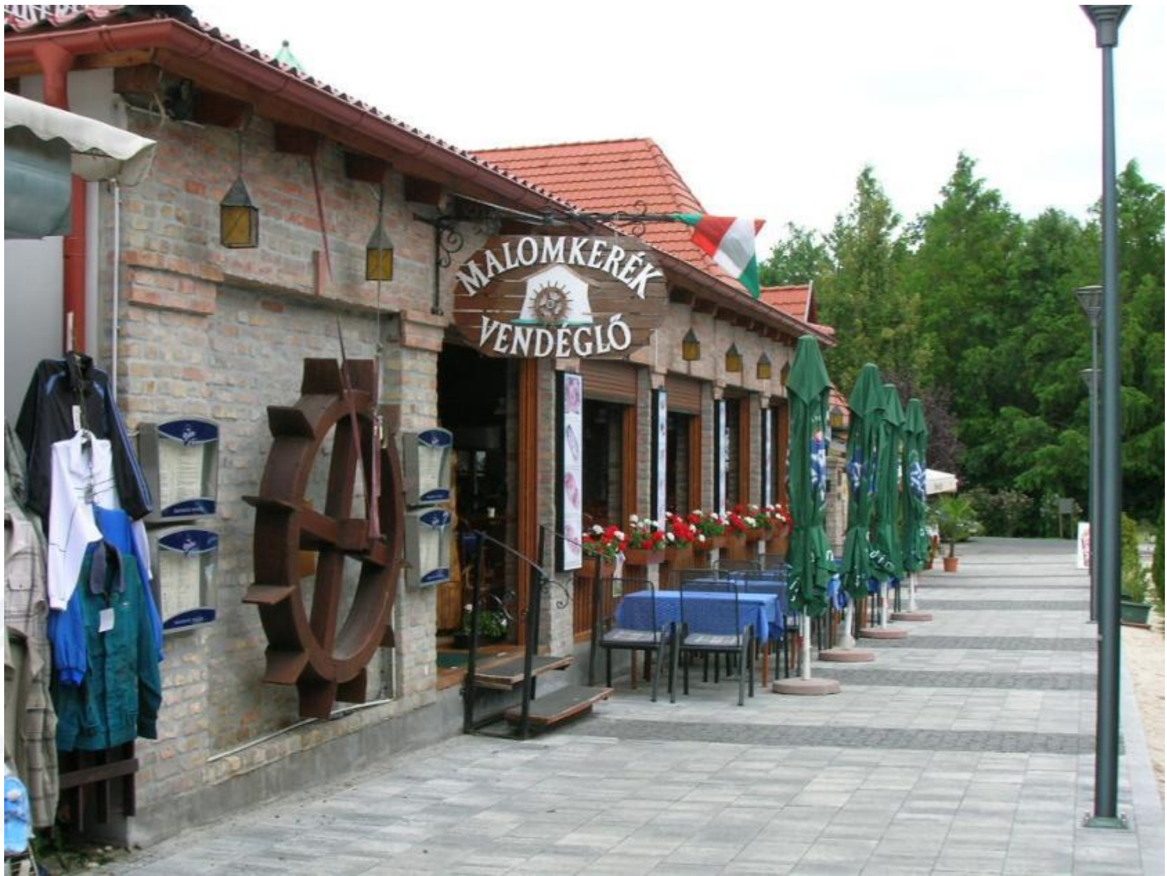
Belváros gyalogos övezet közei, 2010.augusztus