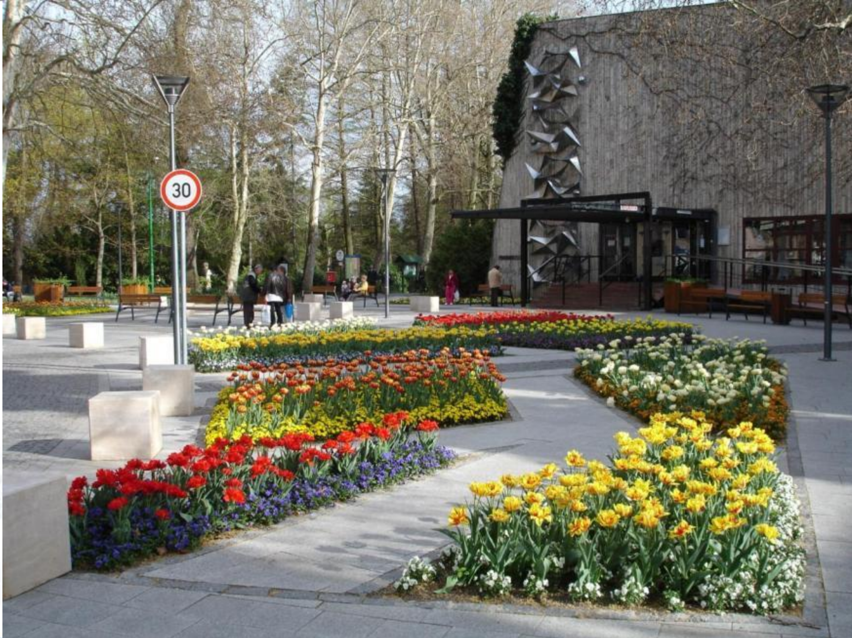
Festetics tér, 2012. május