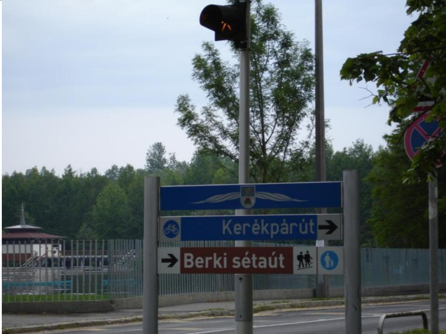
Tófürdő, Ady utca, kerékpárút Keszthely felé