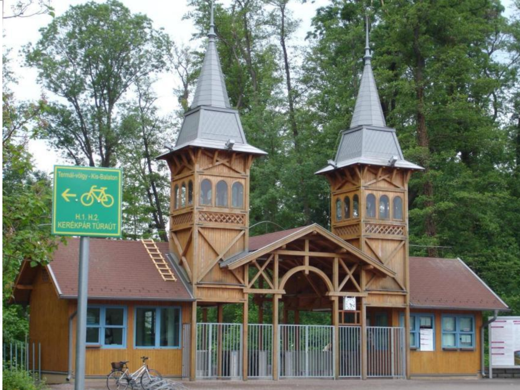
Belváros, Deák tér, Tófürdő nyári bejárat, kerékpárút csatlakozás