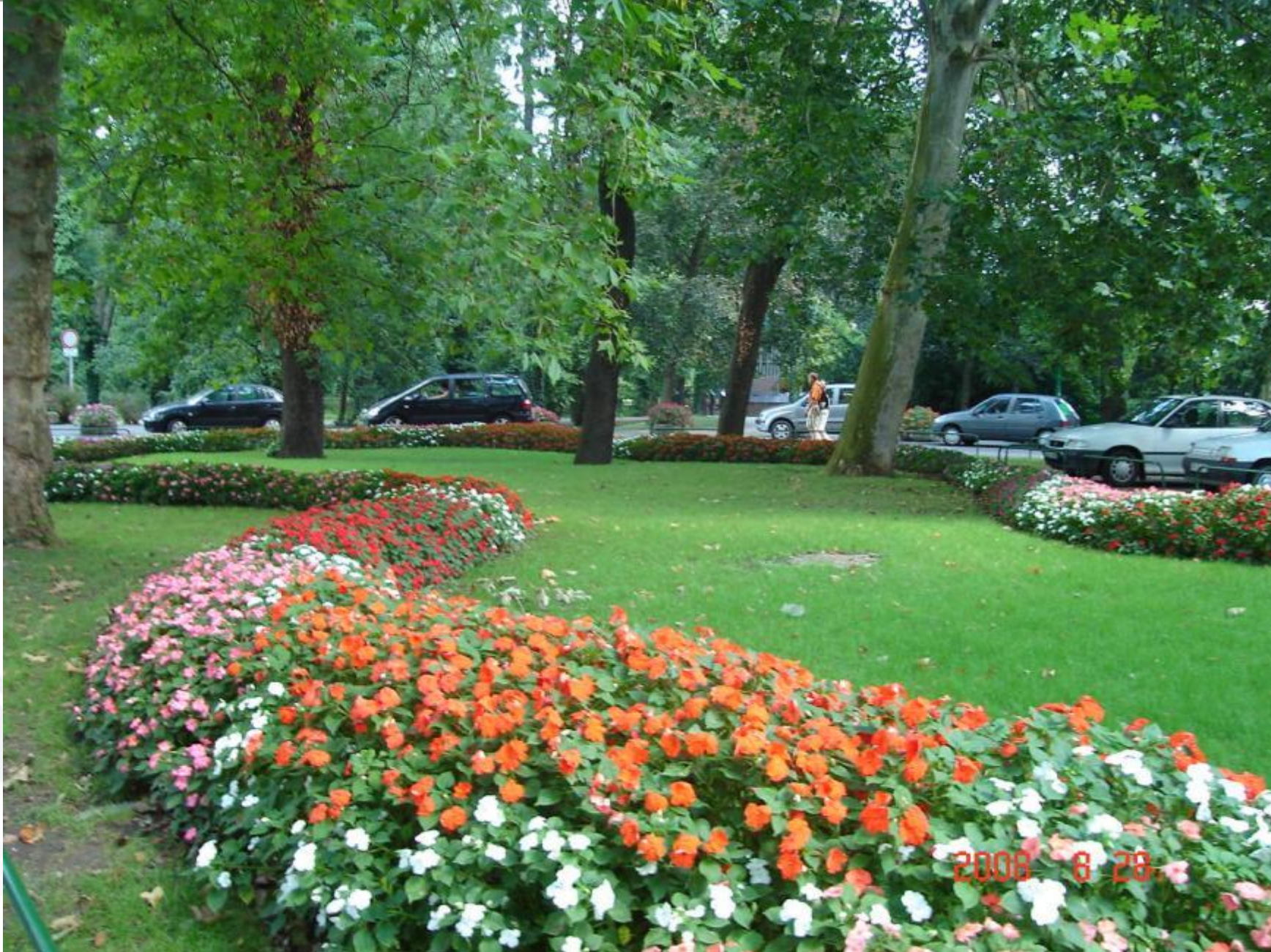
Festetics tér felújítás előtt. Kígyó ágy vízfúksiákkal.