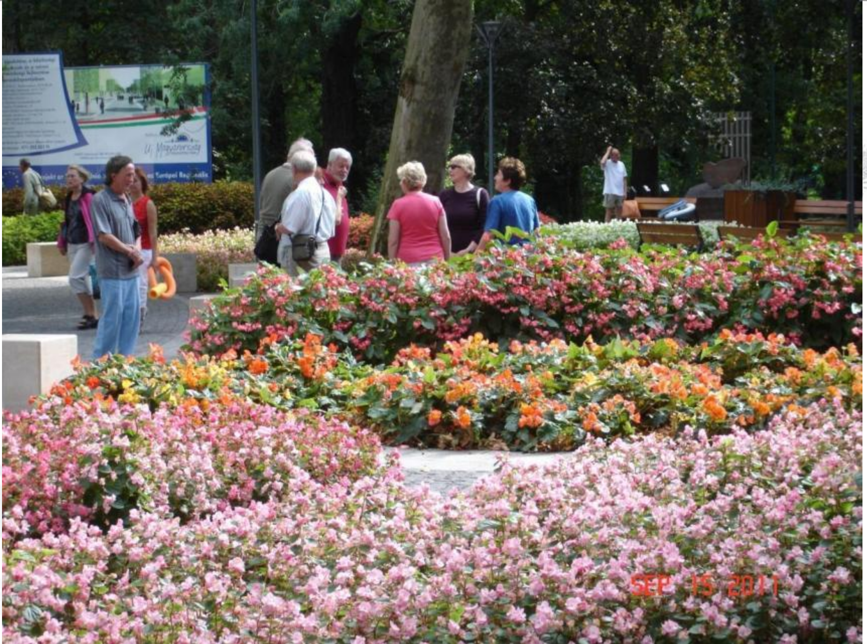
Festetics tér, 2011. szeptember