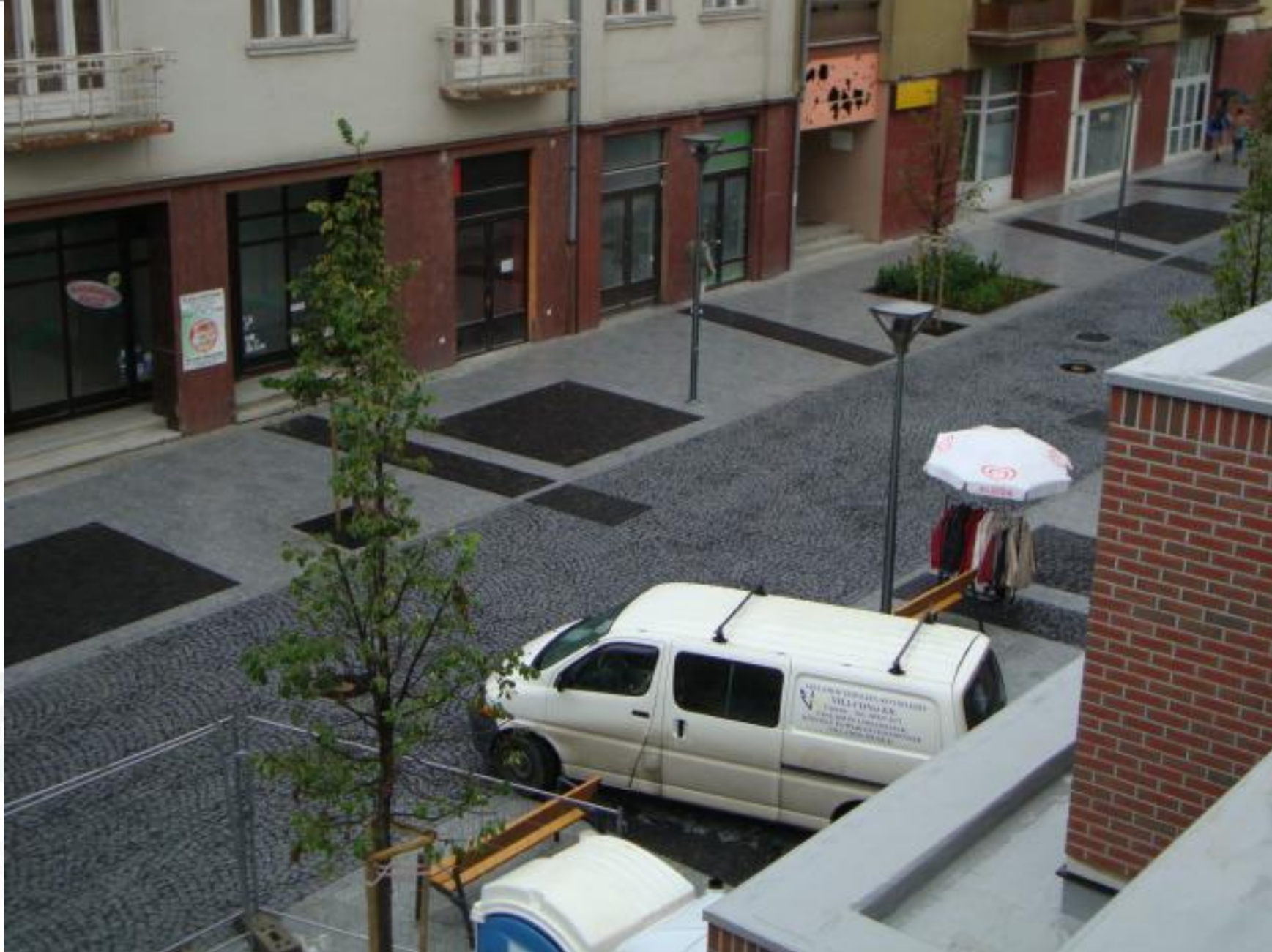
Rákóczi utca, 2010.augusztus (ültetés: 2010. július, 40 fok C, megcsúszott építési határidők)