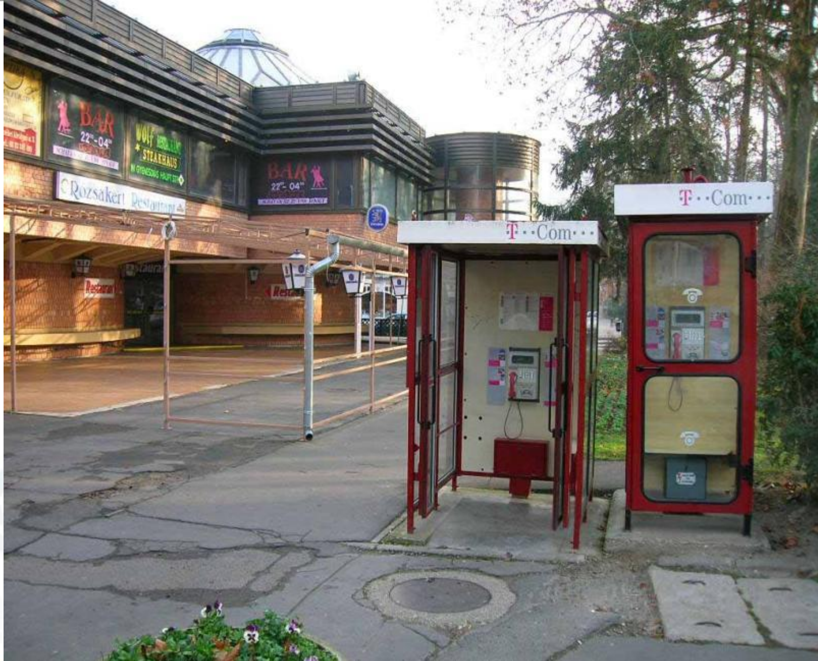
Rózsakert épülete felújítás előtt