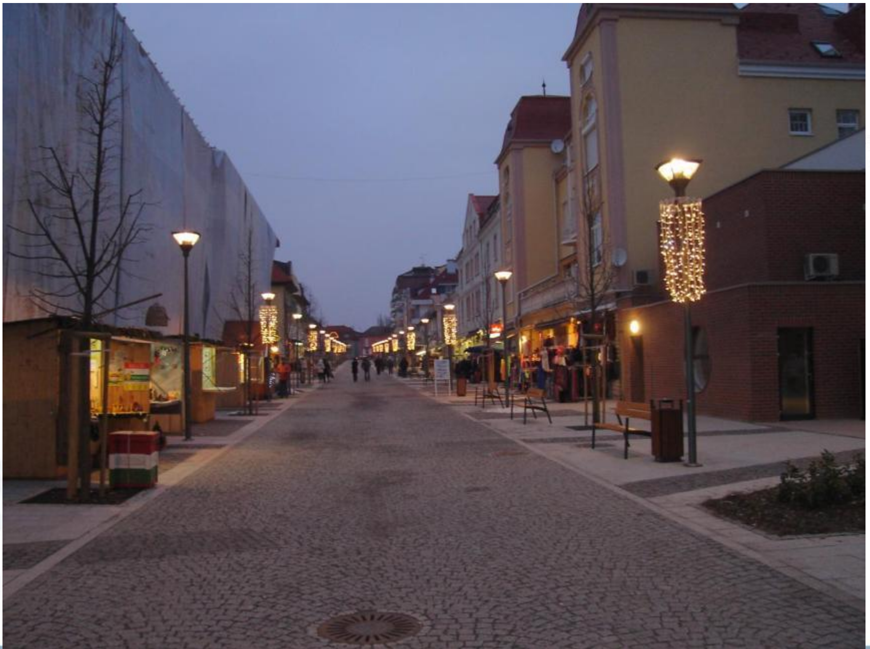
Rákóczi utca, 2010. december, Adventi vásár