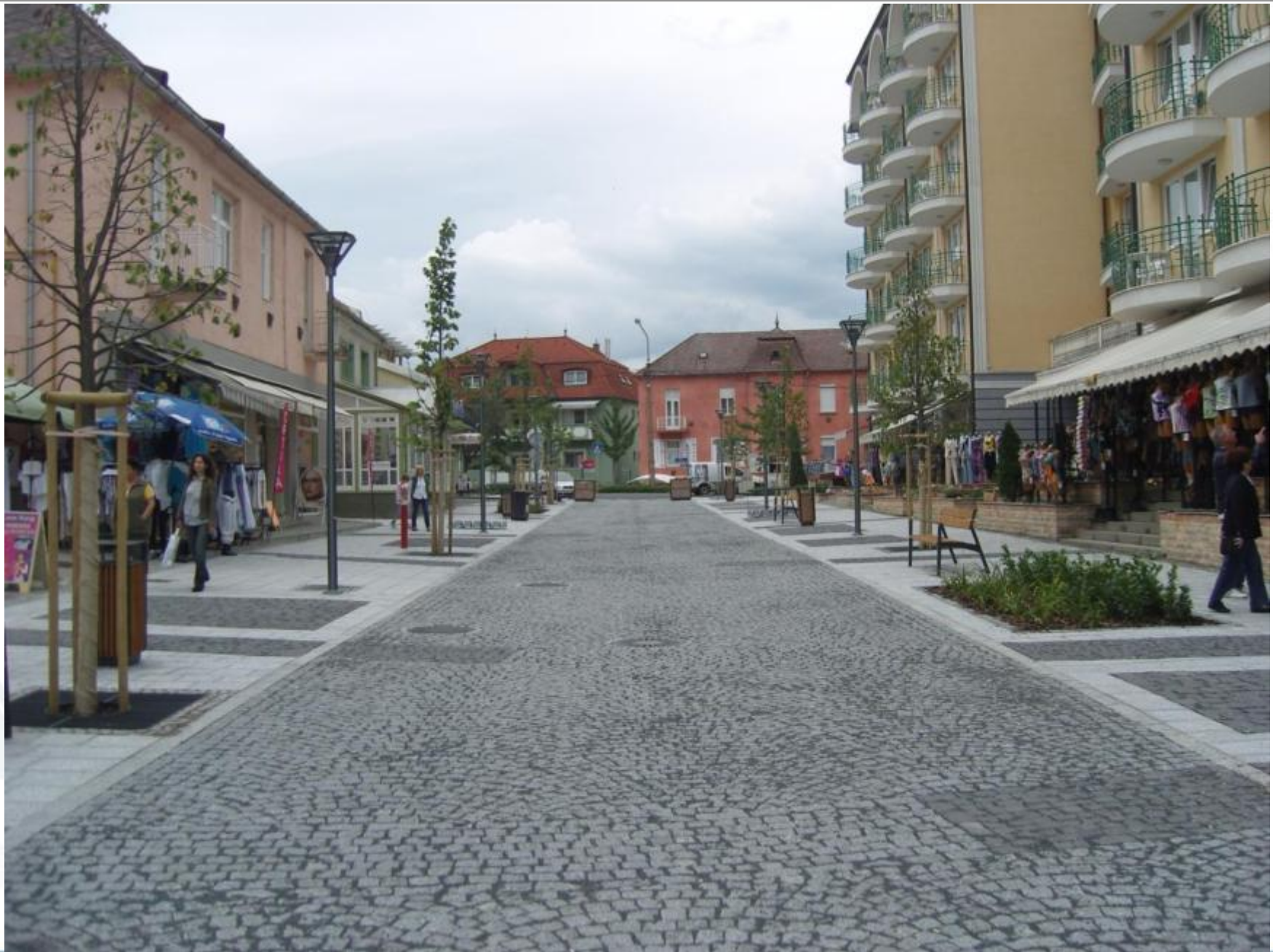
Rákóczi utca, 2010.augusztus. Napégés törzsön, kéreg elhalás, másodlagos gombafertőzés, nagy mértékű törzspusztulás.