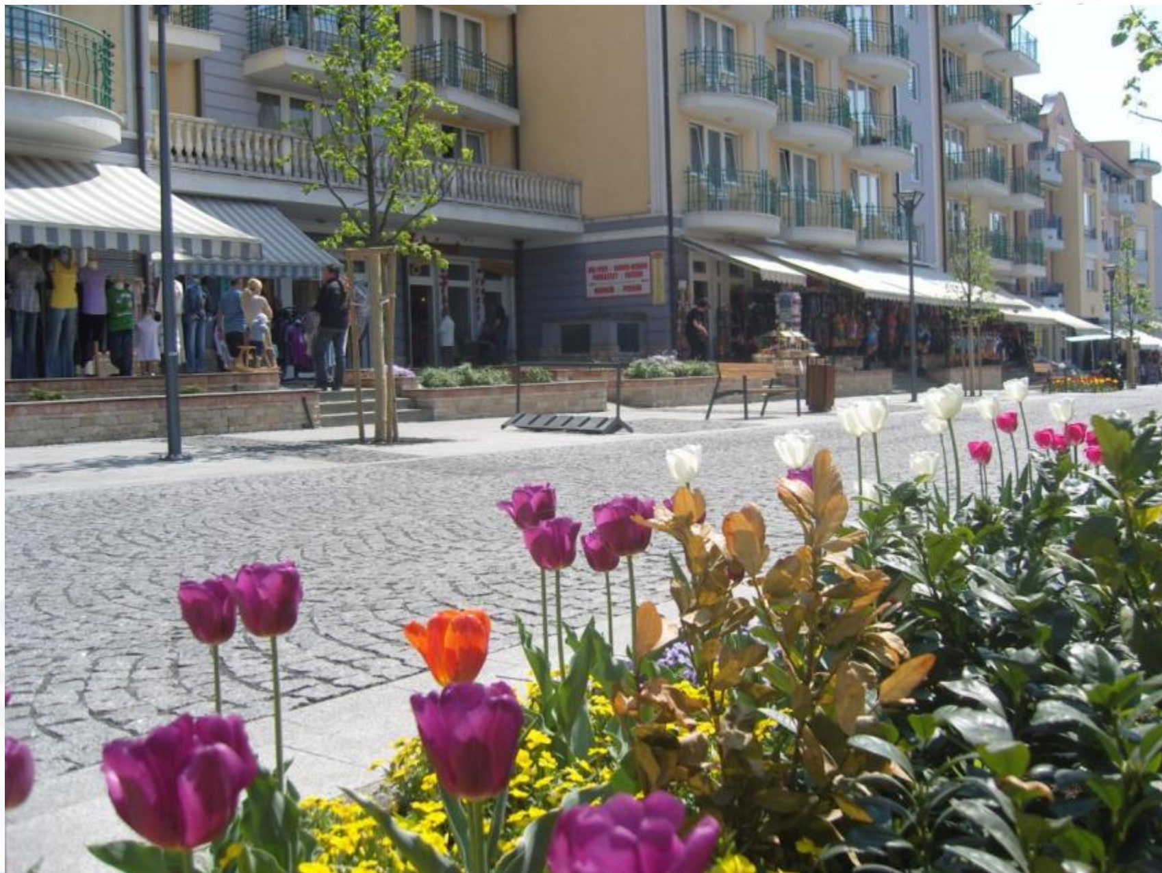
Rákóczi utca, 2011.április, az új fasorral, átültetett ágyakkal.