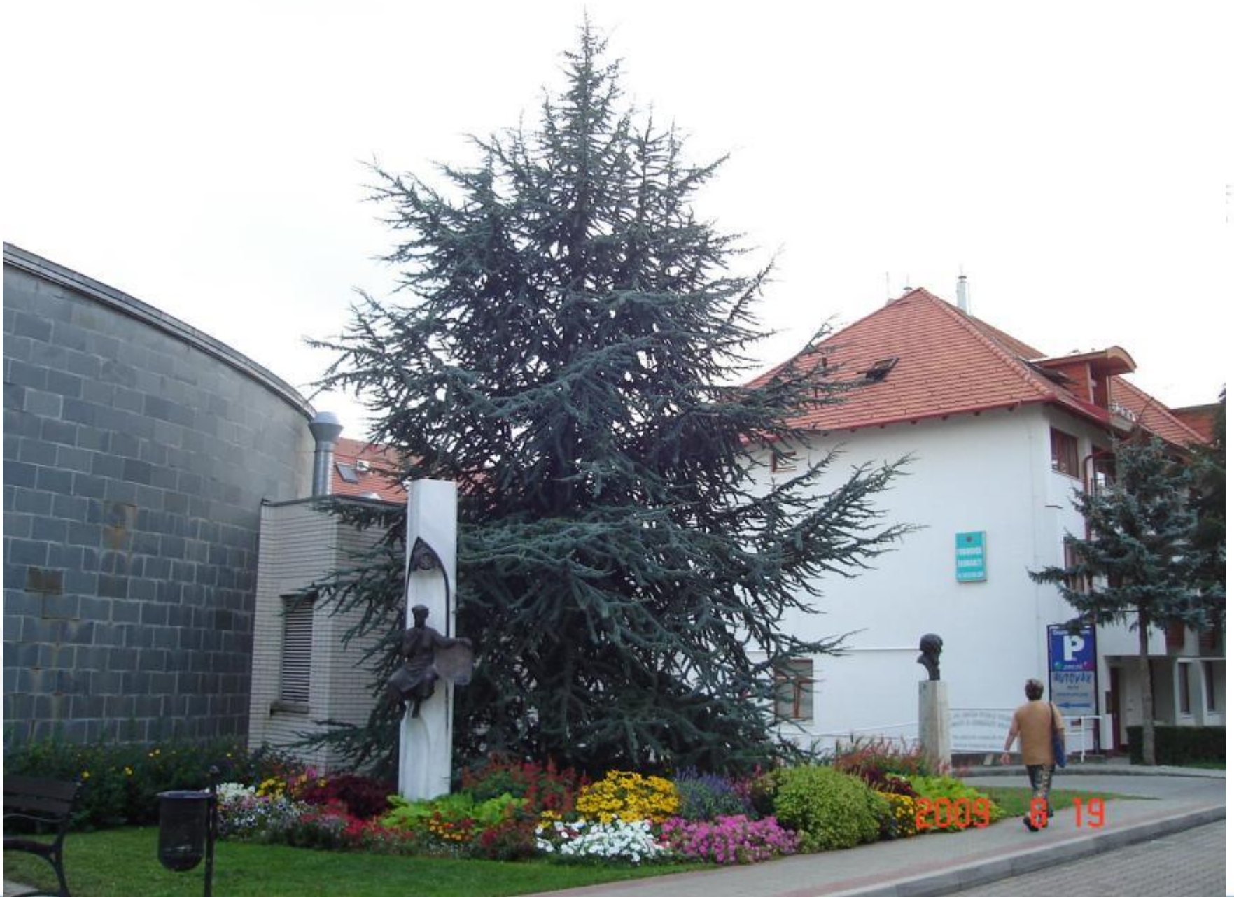
Kossuth utca Cedrus körül