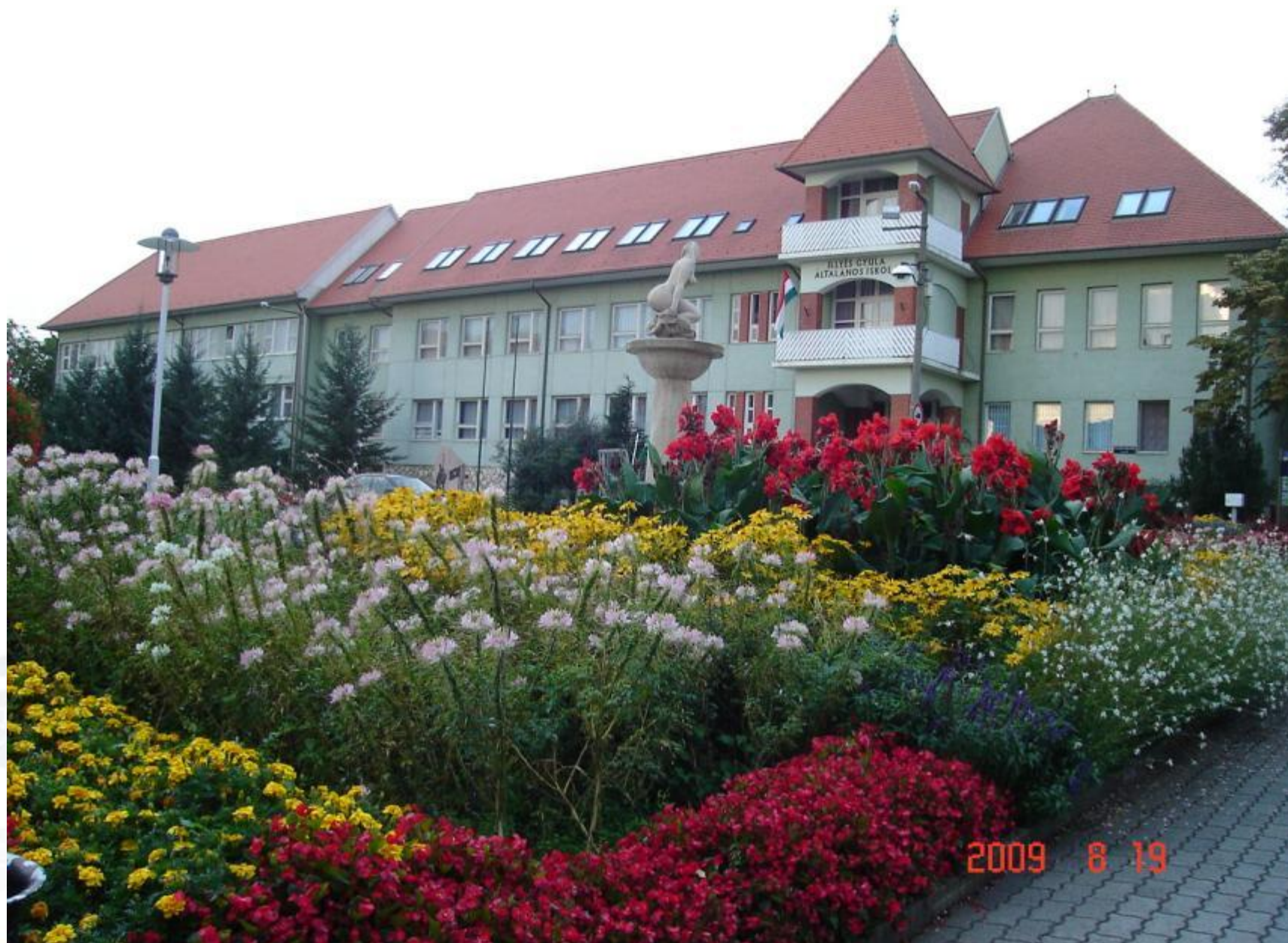
Polgármesteri Hivatal előtt, 2009-ben