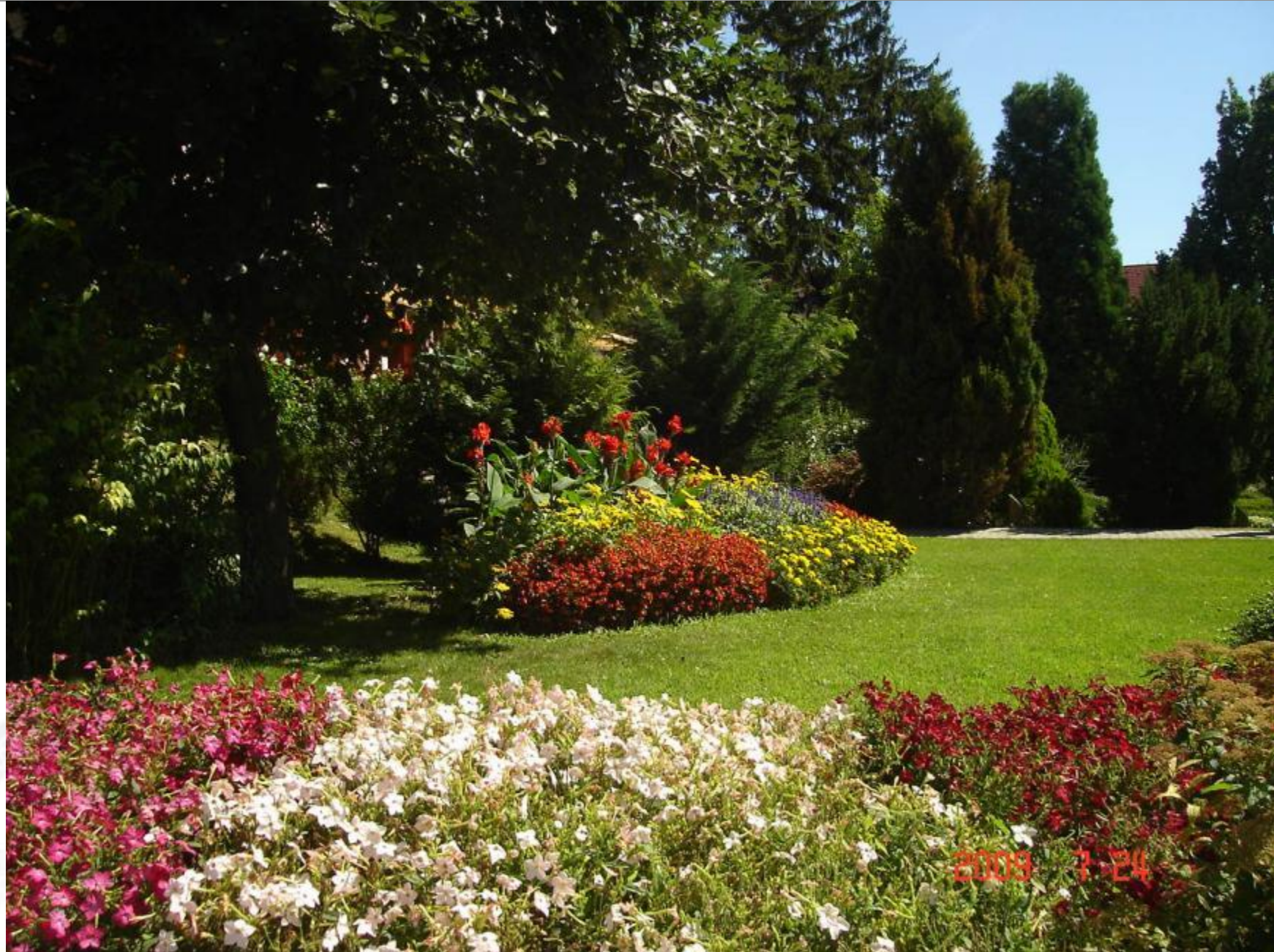
Moll Károly tér