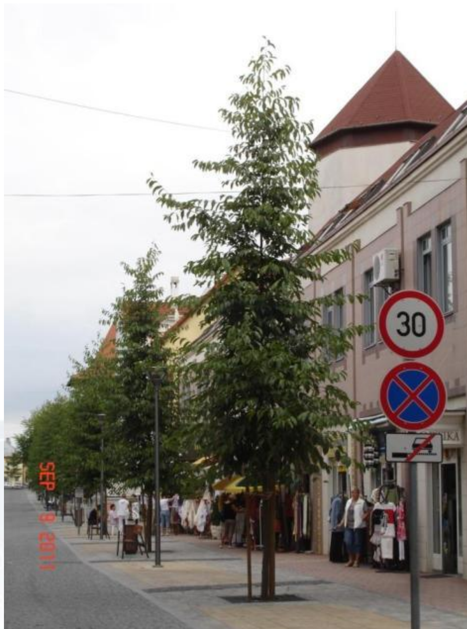
Erzsébet királyné utca, 2011.szeptember