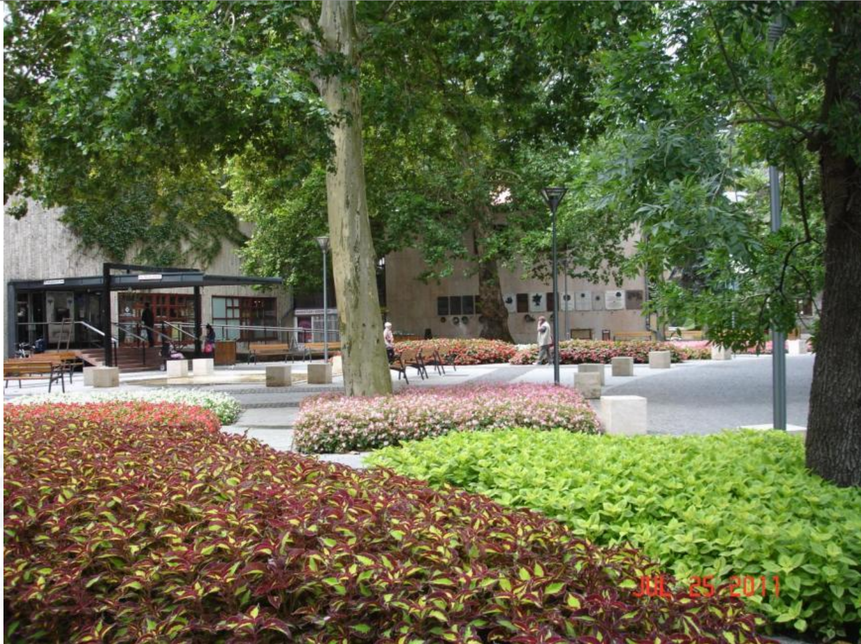
Festetics tér, 2011. július, platánok, kőrisek alatt, Coleusok