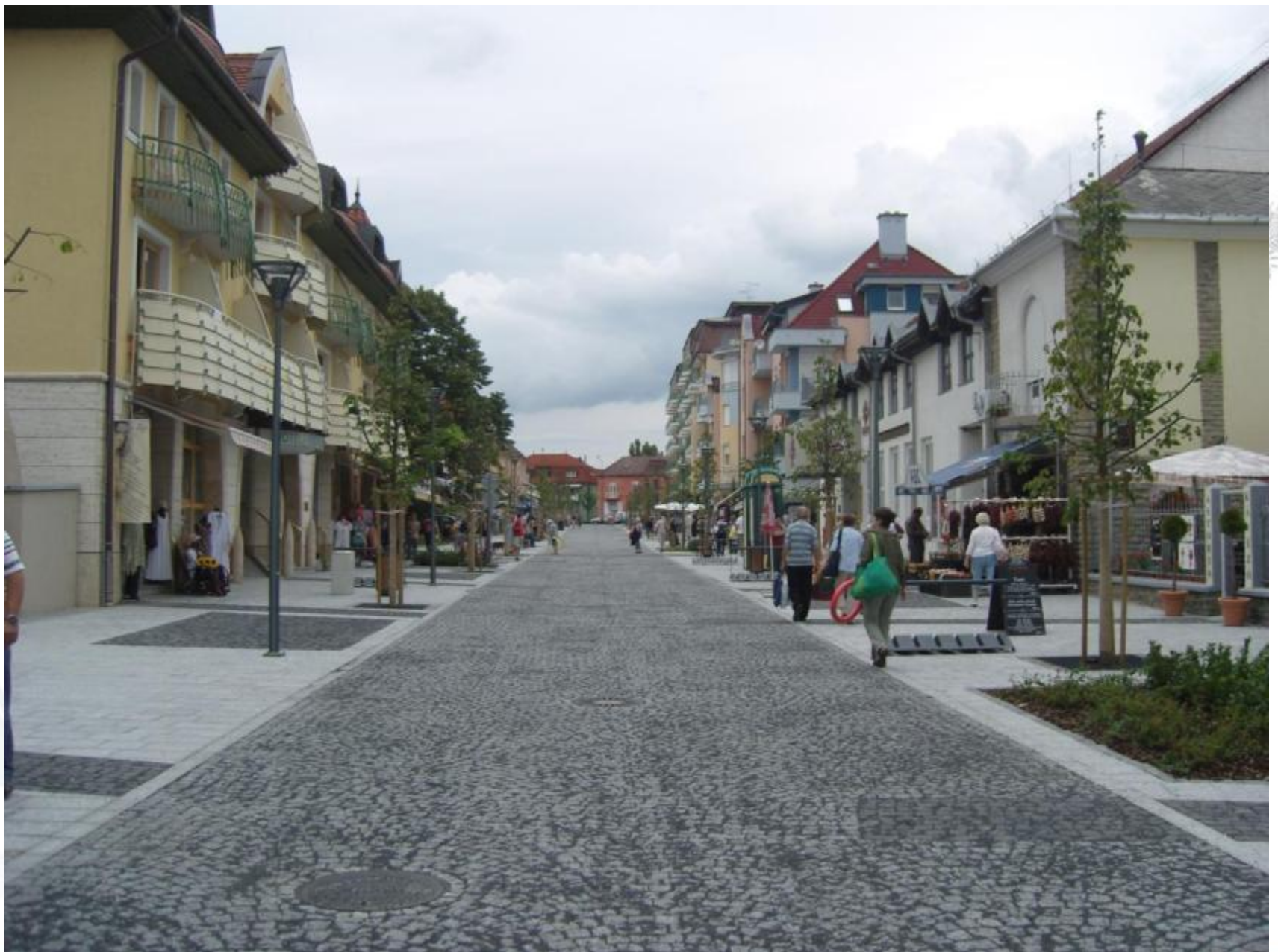
Rákóczi utca, 2010.augusztus. Zöldfelület növelő beépített ágyak: örökzöld cserje, évelők.