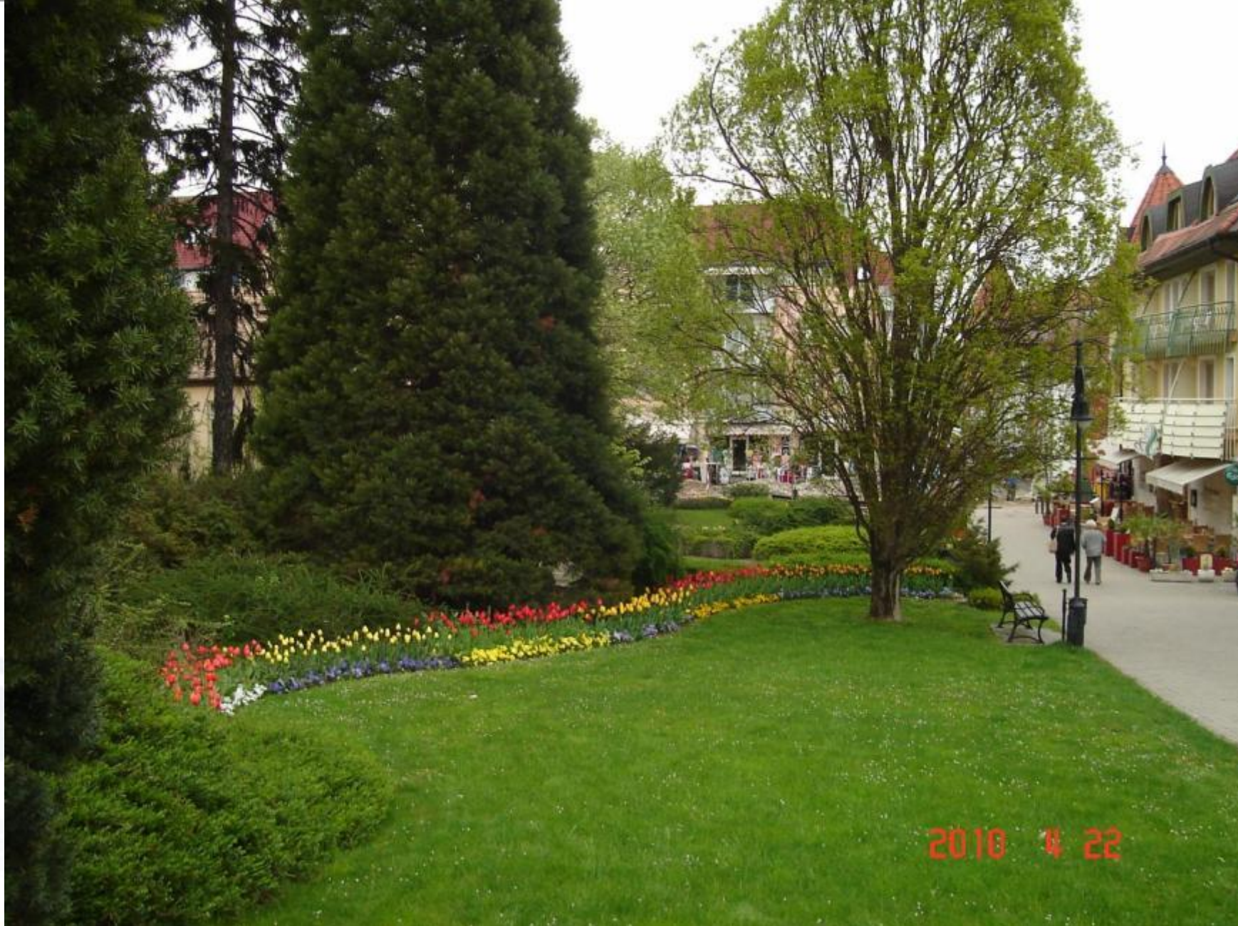
Moll Károly tér