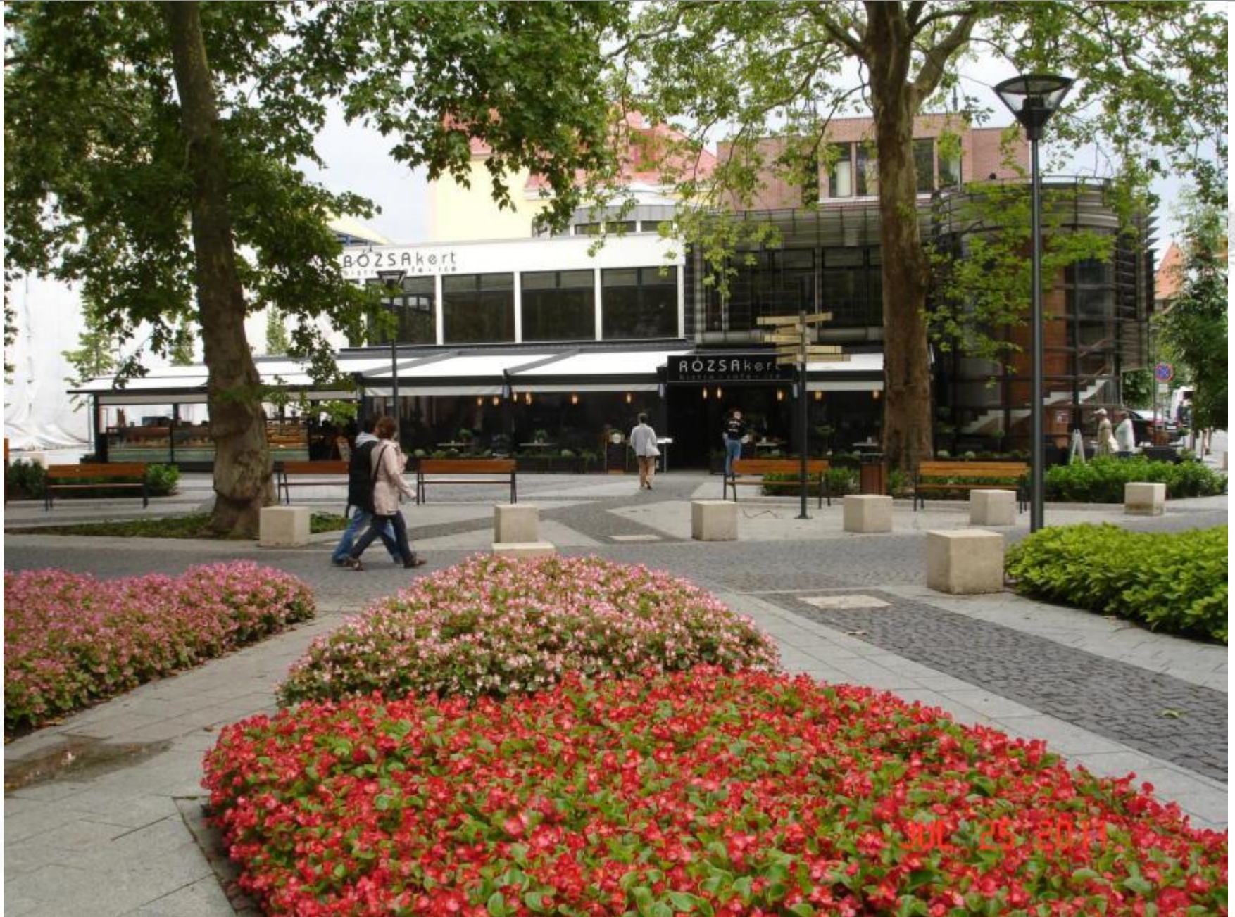
Festetics tér, 2011. június, a működő Rózsakert étterem, Volumnia Begoniák