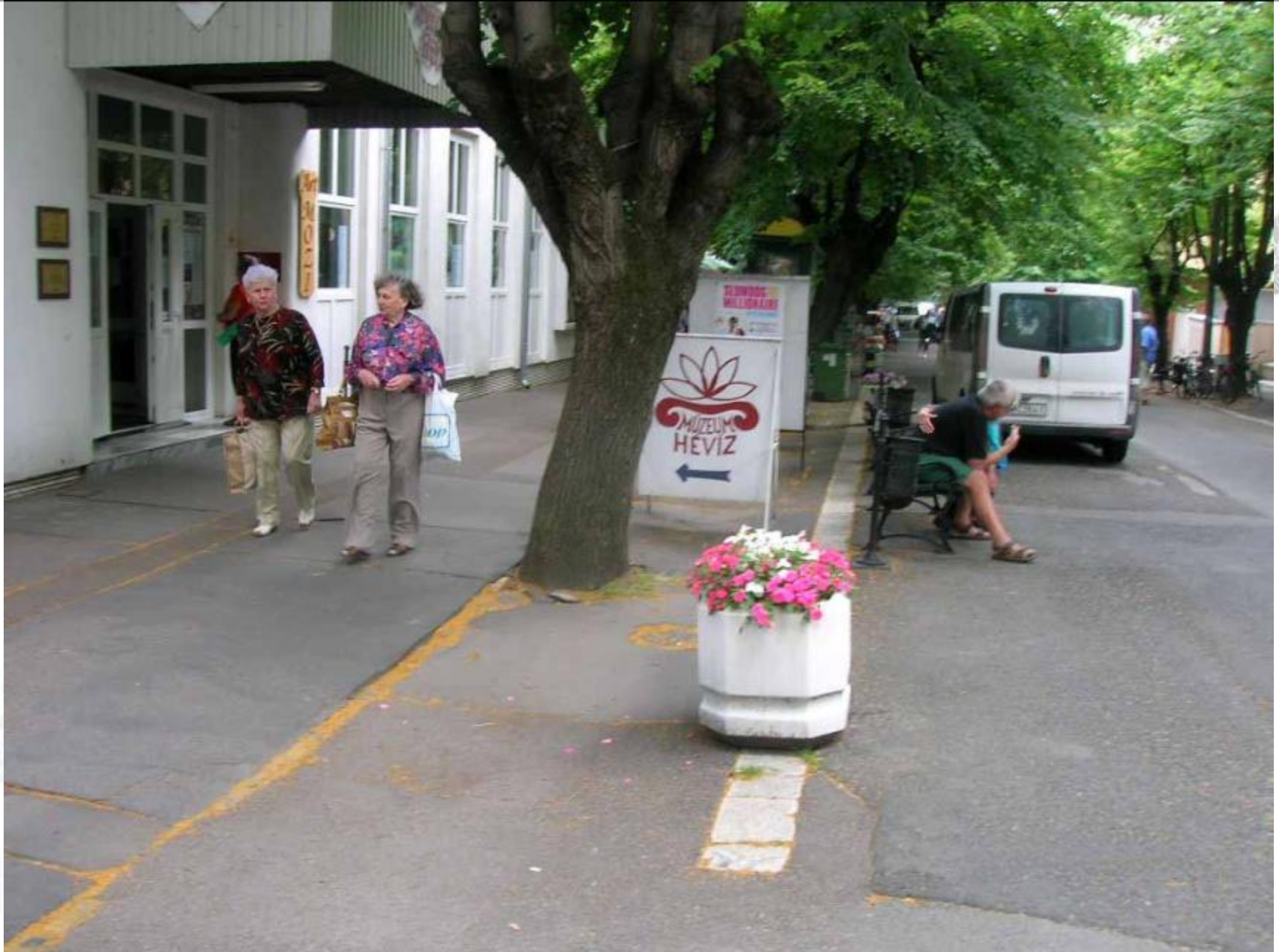
Körbe aszfaltozott hárs a Rákóczi utcában, lombfelület (57 fa).