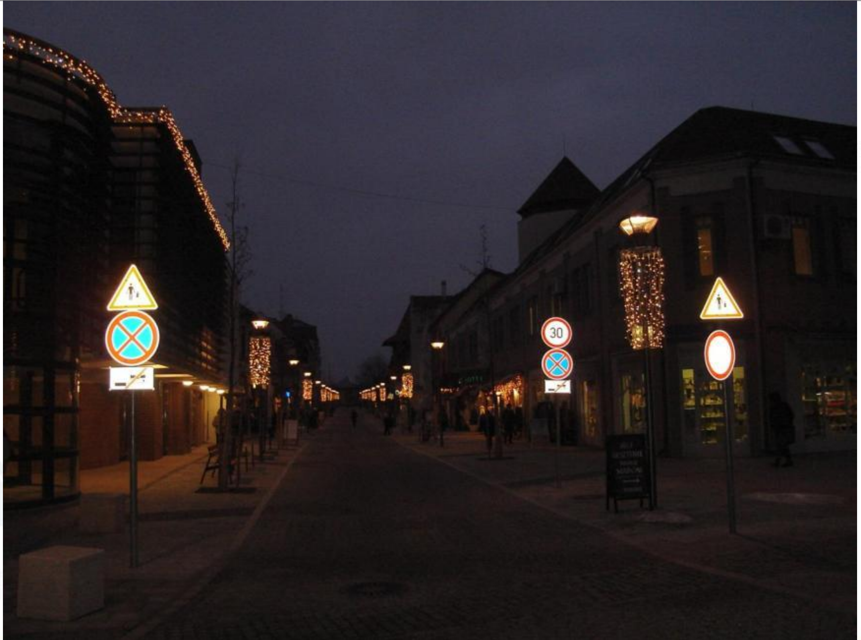
Erzsébet királyné utca, 2011. december