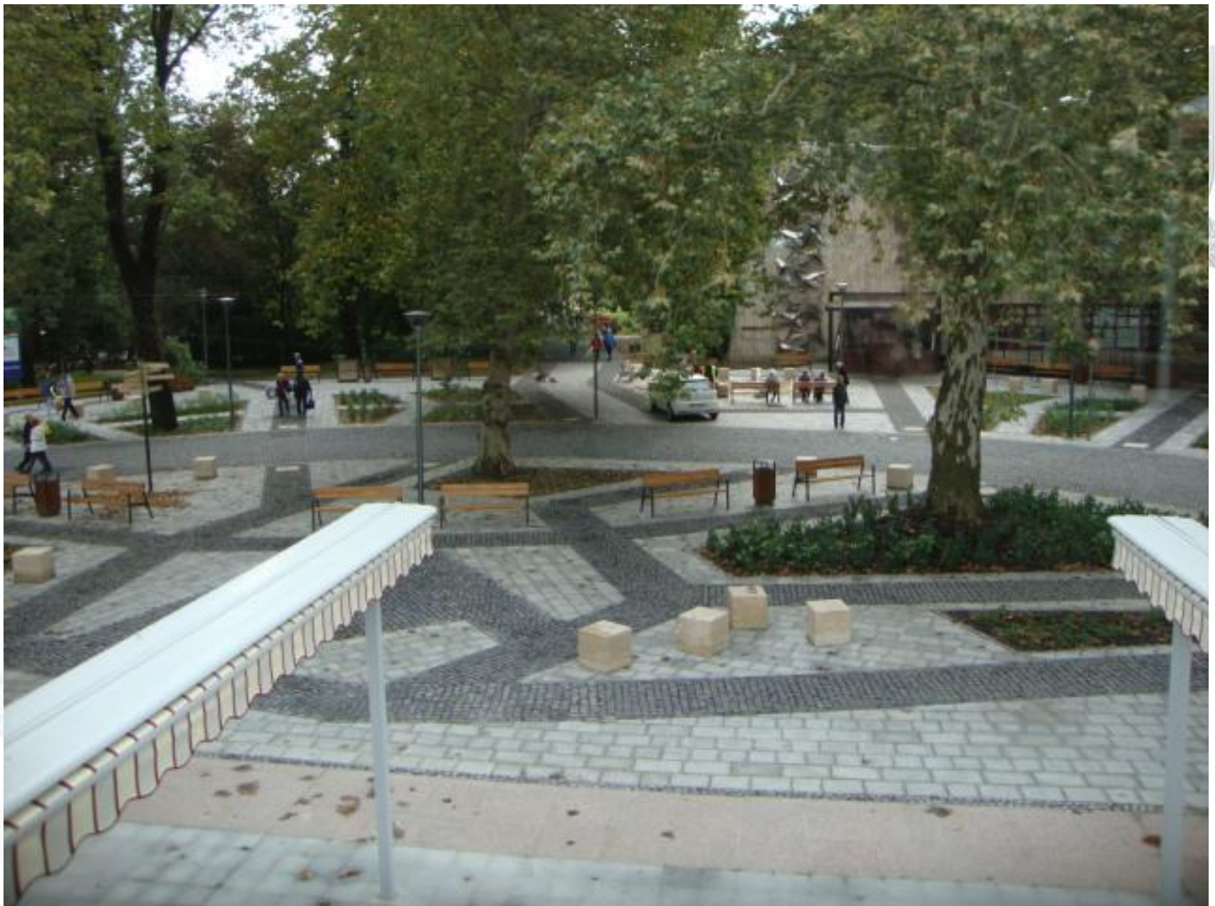
Festetics tér, 2010. szeptember, átadás után