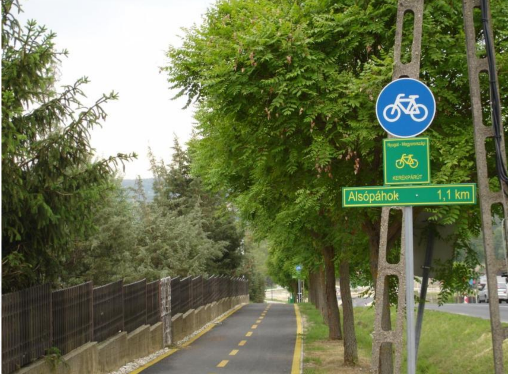
Ady utca, kerékpárút Alsópáhok felé