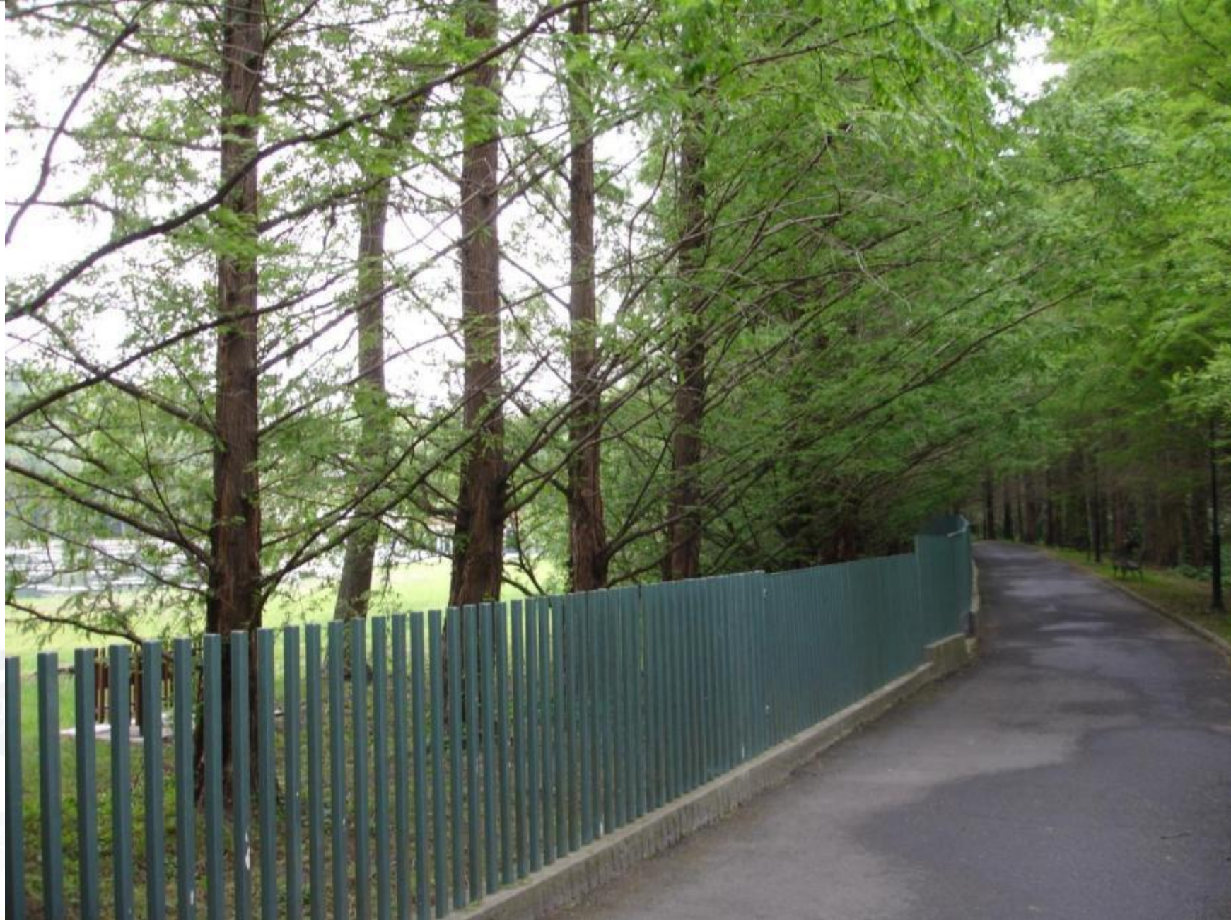
Tófürdő, északi véderdő, mocsári ciprusok, kerékpárút